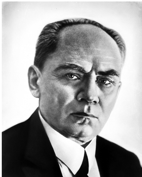
3. „Prezydent” Rzeczypospolitej zakopiańskiej Stefan Żeromski