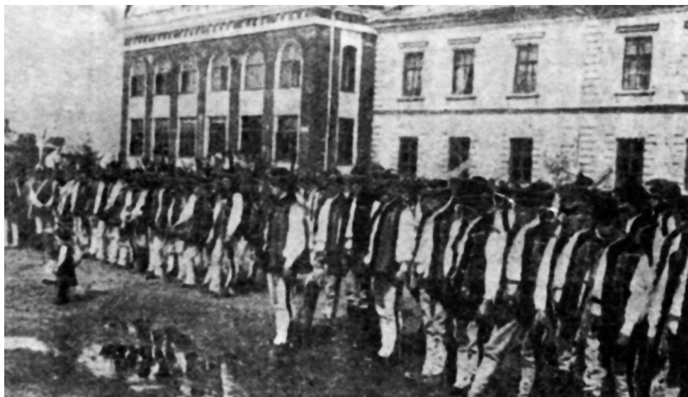
5. Uroczystości obchodów Konstytucji 3 maja 1913 r. przed gmachem Towarzystwa Gimnastycznego „Sokół” w Nowym Targu