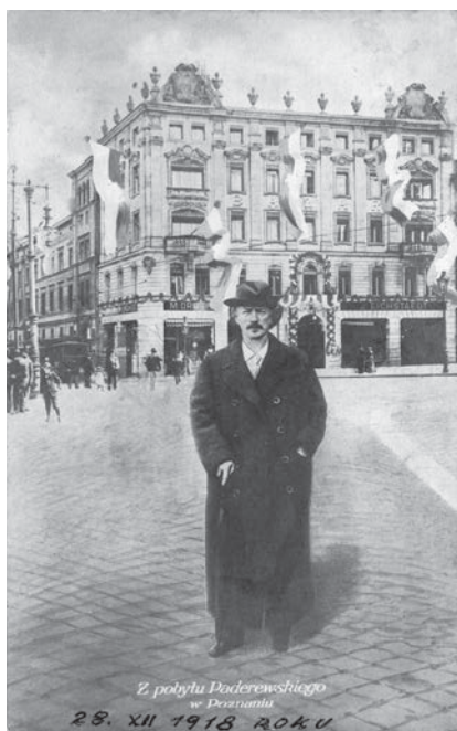
3. Ignacy Paderewski przed hotelem Bazar w Poznaniu, grudzień 1918 r.