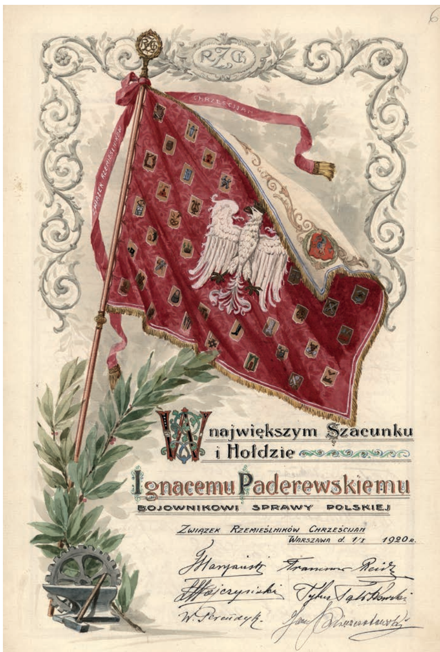
7. Dyplom od Związku Rzemieślników Chrześcijan w Warszawie z podziękowaniem dla Paderewskiego po jego dymisji z funkcji premiera rządu – 1 stycznia 1920 r.