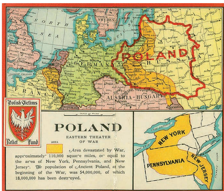
5. Mapa obrazująca zniszczenia wojenne na ziemiach Polski w zestawieniu z terytorium kilku stanów USA, ok. 1917 r.