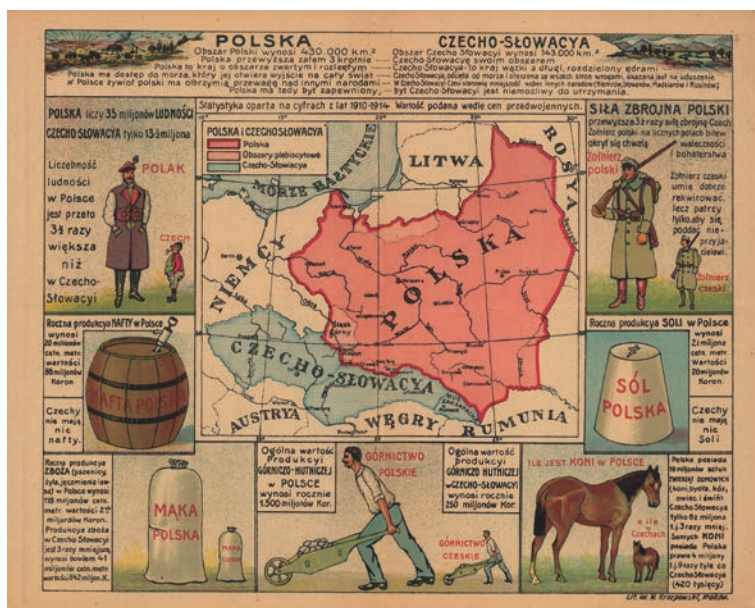
6. Plakat propagandowy z okresu plebiscytu na Śląsku Cieszyńskim