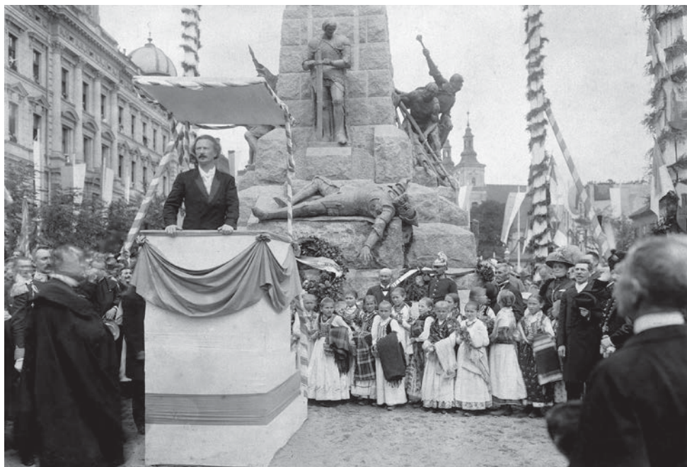
1. Ignacy Jan Paderewski podczas przemówienia na uroczystości odsłonięcia pomnika w 500. rocznicę bitwy pod Grunwaldem, Kraków, 15 lipca 1910 r.