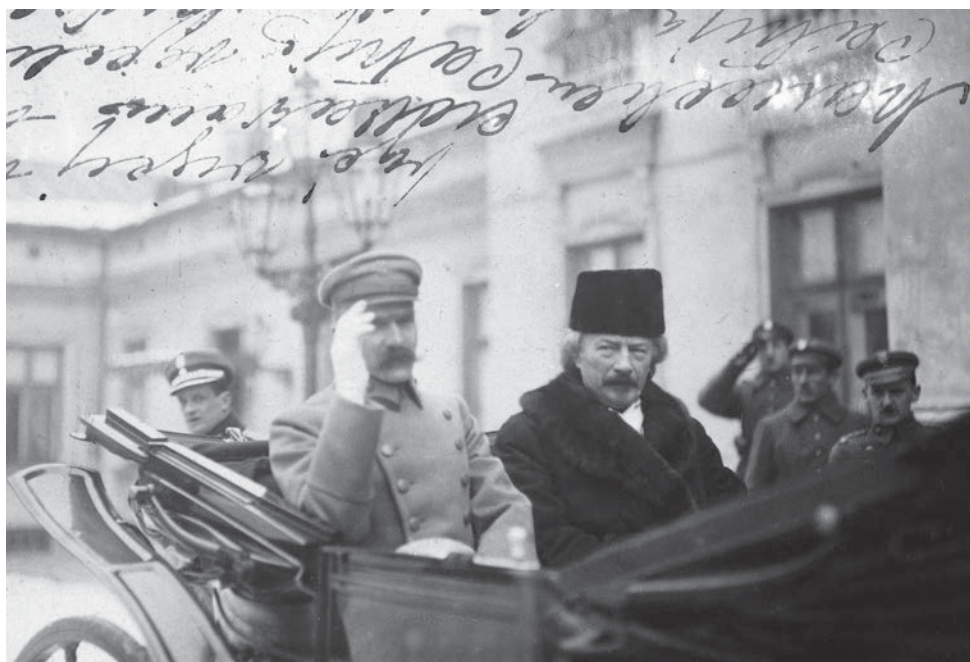
4. Naczelnik państwa Józef Piłsudski i premier Ignacy Paderewski w drodze na obrady Sejmu Ustawodawczego, 10 lutego 1919 r.