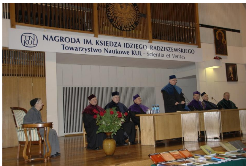
Uroczystość wręczenia dorocznej Nagrody im. Księdza Idziego Radziszewskiego „za wybitne osiągnięcia naukowe w duchu humanizmu chrześcijańskiego”