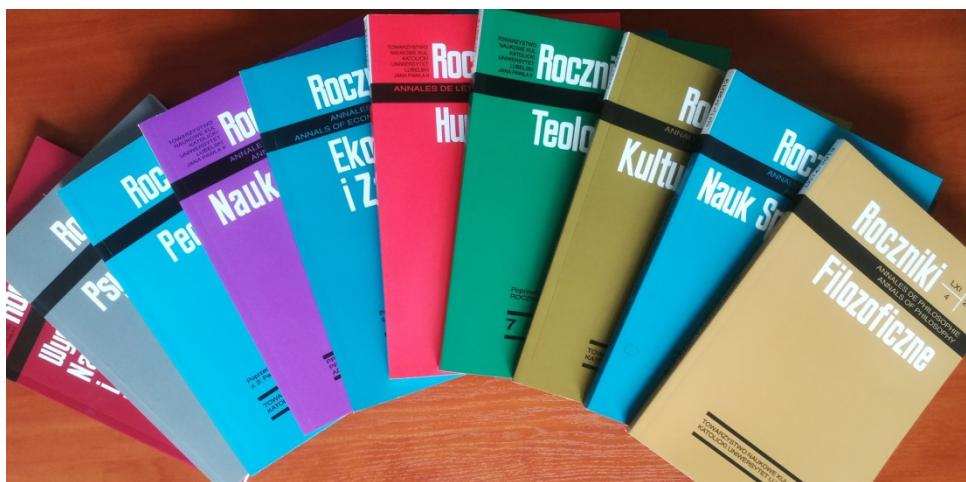
Paleta okładek „Roczników” wydawanych przez poszczególne Wydziały TN KUL