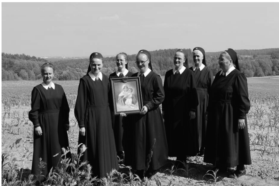
6. 11 czerwca 2015 r. – siostry szensztackie świętujące jubileusz 25 lat pracy na Białorusi