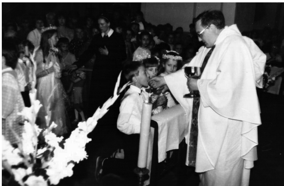
2. 28 lipca 1990 r. – I Komunia św. w katedrze w Grodnie, której udziela abp Tadeusz Kondrusiewicz