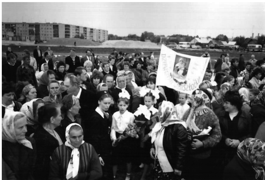
4. 28 maja 1992 r. – grupa dziewcząt szensztackich na terenie budowy kościoła pw. Matki Bożej Trzykroć Przedziwnej w Mostach