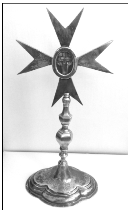
Relikwiarz z relikwiami Krzyża Świętego przechowywany w kościele w Borzykowej

na miejscowy szpital, odnowił srebrną monstrancję i srebrny kielich z pateną oraz zakupił 3 nowe ornaty, kapę czarną, dwie alby, nowe mosiężne urządzenie do wypieku hostii, nowy mszał i 3 obicia karmazynowe. Przekazał również do świątyni srebrny relikwiarz z relikwiami Krzyża Świętego, mający świadectwo autentyczności z 1723 r. i aprobatę do kultu wydaną w 1731 r. przez abp. Teodora Potockiego, metropolitę gnieźnieńskiego. Po śmierci królewicza Jakuba Sobieskiego, u którego w latach 30. XVIII w. był marszałkiem dworu i należał do rady najwyższej zamku w Żółkwi, otrzymał w 1738 r. w ramach wdzięczności od księżnej Marii Karoliny de Bouillon cenne relikwie, podpisane ręką jej ojca. Wśród nich były m.in.: fragmenty szat świętych apostołów: Piotra, Pawła, Jakuba Większego, Jakuba Mniejszego, Judy Tadeusza, Bartłomieja i Tomasza, fragment szaty św. Linusa – papieża, relikwie świętych męczenników: Feliksa, Korneliusza i Leona oraz relikwie świętych: Jana Chryzostoma, Mikołaja z Miry, Benedykta, Deodata, Filipa Nereusza, Antoniego z Padwy, Franciszka z Asyżu, Kajetana, Kazimierza, Ignacego Loyoli, Franciszka Ksawerego, Stanisława Kostki, Jacka, Czesława, Klary i Brygidy. Wszystkie je następnie ofiarował parafii borzykowskiej 44 .