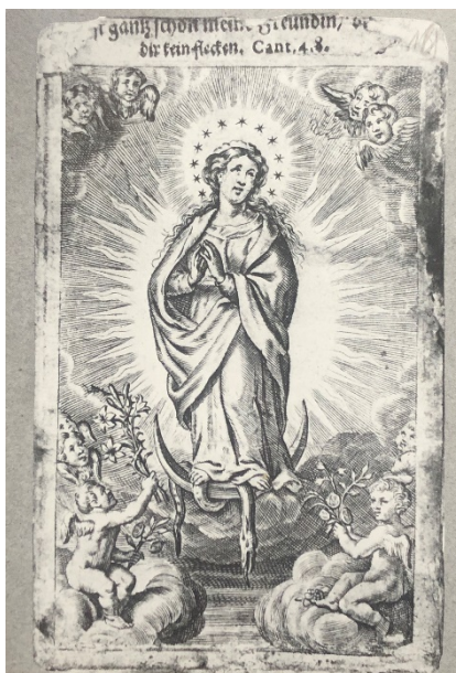
Kronika , sygn. 18, s. 20

w klasztorze w Dortsen (około 50 km na północ od Neviges), ukazała się Matka Boża na niedużym obrazku i poleciła, aby go przeniósł do nowego klasztoru. Ten obrazek do dzisiaj czczony jest w sanktuarium w Neviges 7 .