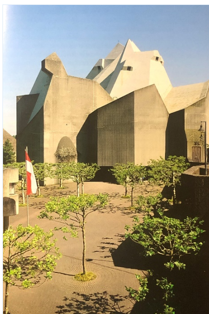
Kronika , sygn. 18, s. 29

nię, jednak okres rządów Hitlera, a następnie wojna uniemożliwiły realizację tych projektów. Po II wojnie światowej liczba pielgrzymów była nadal liczna. Dopiero na początku lat sześćdziesiątych powrócono do pomysłu budowy nowej świątyni. Zrealizowano go w ciągu dziesięciu lat. Nową świątynię (tzw. Mariendom) zbudowano na podstawie projektu architekta Gottfrieda Böhma z Kolonii i jest to koncepcja oparta na popularnym w tamtym czasie nurcie brutalizmu w architekturze. Bryła budowli w kształcie nieregularnej figury o długości 50 m i szerokości 37 m zajmuje powierzchnię około 2000 m 2 . Dach w kształcie trzech zachodzących na siebie betonowych namiotów wznosi się w najwyższym miejscu na wysokość 34 metrów. Symbolicznie budowla ma być widocznym znakiem kościoła pielgrzymkowego. W architekturze wewnętrznej i zewnętrznej zawiera wiele symbolicznych elementów nawiązujących do Biblii i liturgii. Centralnym miejscem kultu jest kaplica z czterometrowym słupem, na którym umieszczony jest cudowny obraz Matki Bożej Królowej Pokoju 8 .