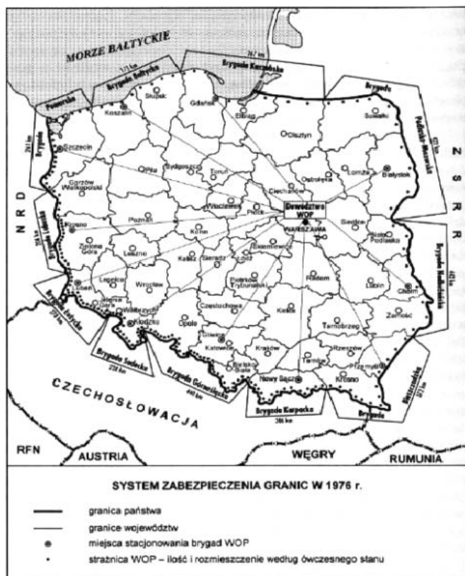
Mapa 2. System zabezpieczenia granic Polski w 1976 r.