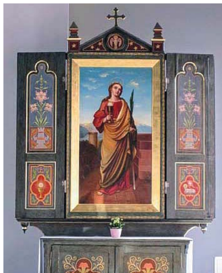
Fot. 3. Ołtarz św. Barbary w kaplicy pod jej wezwaniem (przy centrum handlowym Silesia City Center w Katowicach, 2018 r.)

Barbaro, aby nic mu się złego nie przytrafiło” [zapis. w Rudzie Śląskiej-Bieloszowicach w 2012 r.], „Święta Barbaro, wejrzyj na mnie na dole” [zapis. w Mikołowie w 2013 r.]. W każdej też rodzinie górniczej znajdują się wizerunki patronki górniczego stanu, często wykonane z węgla (figurki, płaskorzeźby, zob. fot. 4-5), górnicy noszą przy sobie także poświęcone medaliki z jej obliczem. Stosunkowo nową formą są tatuaże przedstawiające św. Barbarę (również symbole górnicze, szyby kopalniane itp.), którymi górnicy ozdabiają swoje ciała, traktując je jak swego rodzaju amulety ochraniające ich przed wypadkami pod ziemią 4 .