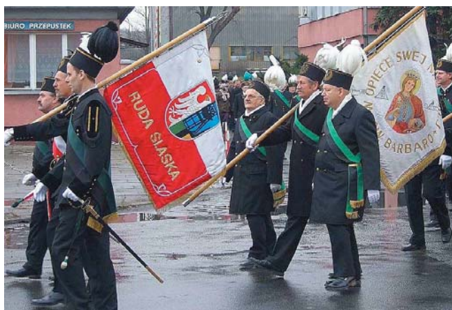
Fot. 6. Przemarsz górników z cechowni kopalni „Halemba” do kościoła (4.12.2012 r.,)