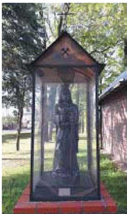
Fot. 5. Rzeźba św. Barbary z węgla przy kościele parafialnym w Ornontowicach (2018 r.)