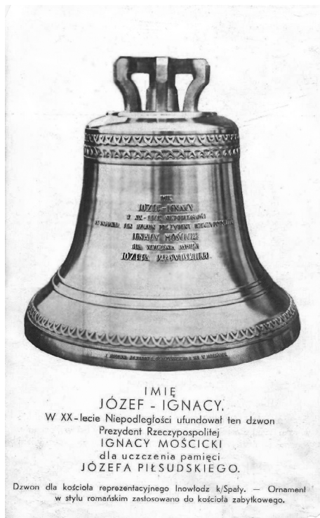
Il. 4. Dzwon JÓZEF-IGNACY ufundowany dla kościoła w Inowłodzi

Na jego ostatniej stronie przedstawiono fotografię dzwonu z następującym podpisem (il. 4):