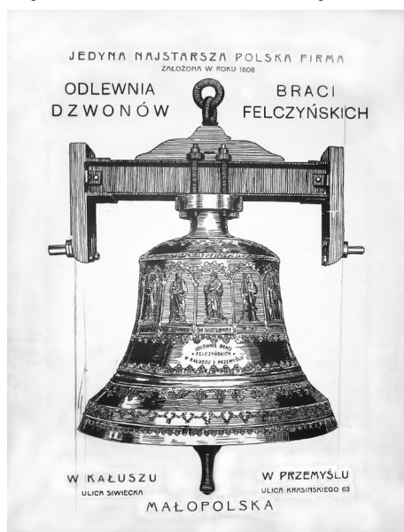
Il. 1. Odlewnia dzwonów Braci Felczyńskich

W pierwszej z tych ofert, z 1926 r. zamieszczano wiele podziękowań, zawierających również informacje o okolicznościach fundacji dzwonów (il. 1).