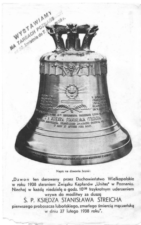
Il. 5. Dzwon ufundowany na pamiątkę męczeńskiej śmierci ks. Stanisława Streicha

Wśród tekstów, proponowanych we wzorach napisów, można tu na marginesie wskazać teksty nawiązujące do akcji rekwizycyjnej z 1917 r., takie jak ten podany w przykładzie trzynastym oferty z 1938 r.