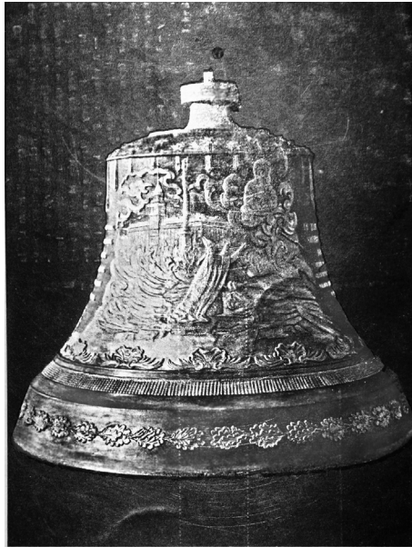
„Cud nad Wisłą“.