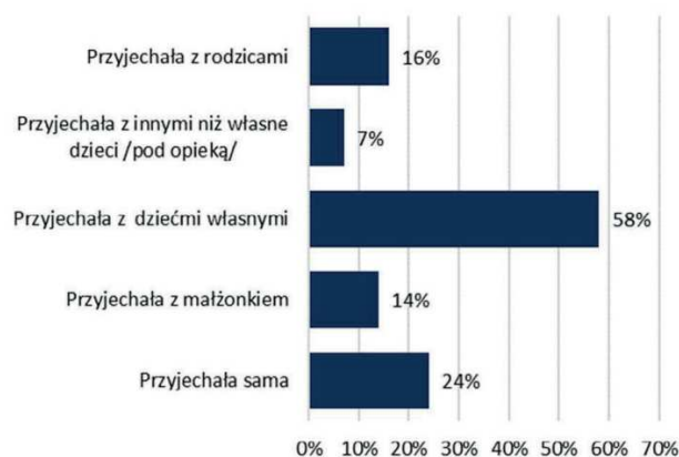
Wykres 1. Dane statystyczne (stan na maj 2022 roku) przedstawiające odpowiedź na pytanie: Czy po wybuchu wojny przyjechały z Panią do Polski inne osoby z rodziny? (można było wskazać więcej niż jedną odpowiedź)