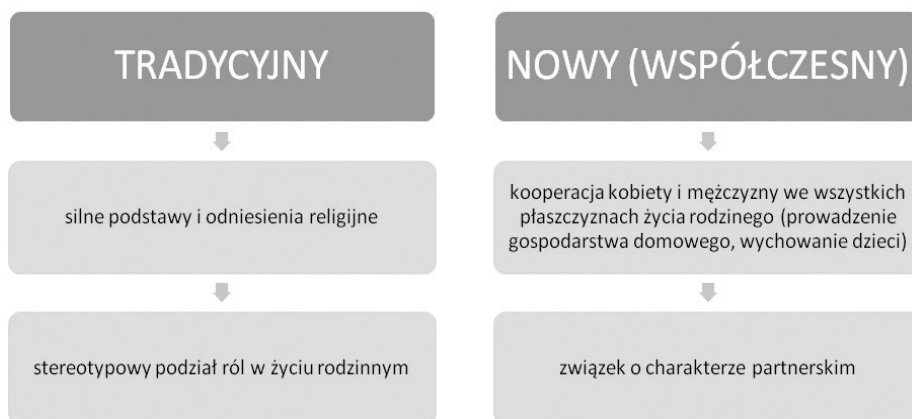
Rys. 1. Cechy tradycyjnego i nowego modelu ojcostwa

gicznej pojawiają się najczęściej dwa modele ojcostwa: tradycyjny oraz nowoczesny. W naszym przekonaniu zasadne będzie zastąpienie określenia „nowoczesny model ojcostwa” pojęciem „nowy” lub „współczesny” model, jako alternatywny do istniejącego do chwili obecnej. Pierwszy z nich stosunkowo mocno zarysowuje stereotypowy podział ról w rodzinie: matki i ojca. Drugi zaś model ukazuje współpracę pomiędzy kobietą i mężczyzną, którzy tworzą partnerski związek, polegający na kooperacji obojga rodziców w pracach domowych i procesie wychowania rodzinnego. Paweł Kubicki 4 dodatkowo w obrębie modelu nowego proponuje wyróżnić dwa jego odłamy: „katolicki” i „świecki” 5 . W obu znaczenie ma zaangażowanie emocjonalne ojca, które jest dokumentowane jego miłością do dziecka. Model katolicki w większym stopniu nawiązuje do tradycyjnego modelu ojcostwa, świecki natomiast do współczesnego.