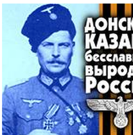
Mem zaburzający linearność przekazu