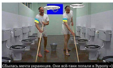
Mem zaburzający linearność przekazu