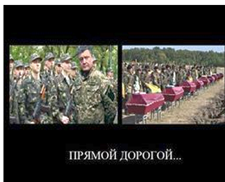
Mem rozwijający (z opóźnieniem)