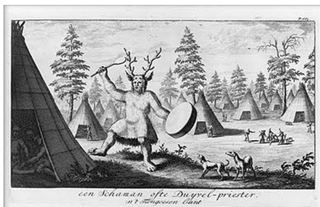
Tungus shaman, 1785 r.

Ulgen stworzył na początku tylko jednego człowieka i miał później ogromne trudności ze znalezieniem dlań odpowiedniej duszy. Był tym bardzo zmartwiony, bo człowiek bez duszy żyć nie może. Pewnego razu wybrał się więc na poszukiwanie przedmiotu swego wiecznego utrapienia i aby człowiekowi nie stała się żadna krzywda, zostawił na jego straży psa bez sierści. Nieobecność Ulgena wykorzystał zły brat Erlik, który obiecał „nagiemu strażnikowi”, iż jeżeli ten dopuści go do człowieka, da mu sierść niezbędną w czasie mrozów. Pies wprawdzie obawiał się gniewu Ulgena, lecz miłsze było mu życie. Zdecydował się w końcu wpuścić Erlika. Erlik pomazał człowieka błotem, następnie napluł na niego i odszedł. Gdy powrócił Ulgen — nie znalazłszy duszy — pies przyznał się do zdrady. Ulgen pomyślał wówczas, że Erlik zna z pewnością miejsce, w którym znajduje się dusza człowieka. Przywołał go więc do siebie i na postawione pytanie otrzymał twierdzącą odpowiedź, z jednym wszak zastrzeżeniem. Erlik zgodzi się wyposażyć człowieka w duszę pod warunkiem, iż będzie ona pod jego władaniem, ciałem natomiast może dysponować jego stwórcy Ulgen. Nie widząc innego rozwiązania, Ulgen przystał na propozycję. Wówczas Erlik poszedł w tajgę, znalazł odpowiedni kawałek drewna, zrobił w nim otwór, przez który później tchnął w usta człowieka duszę. Od tej pory, zgodnie z umową, po śmierci każdego człowieka jego dusza należy do Erlika 20 .