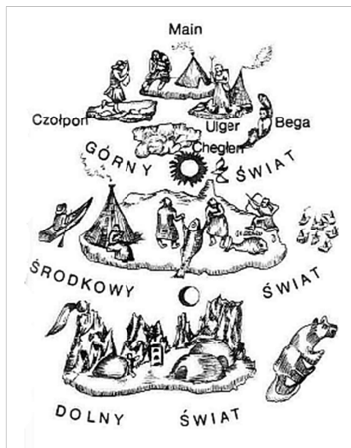
Ewenkijska wizja wszechświata.