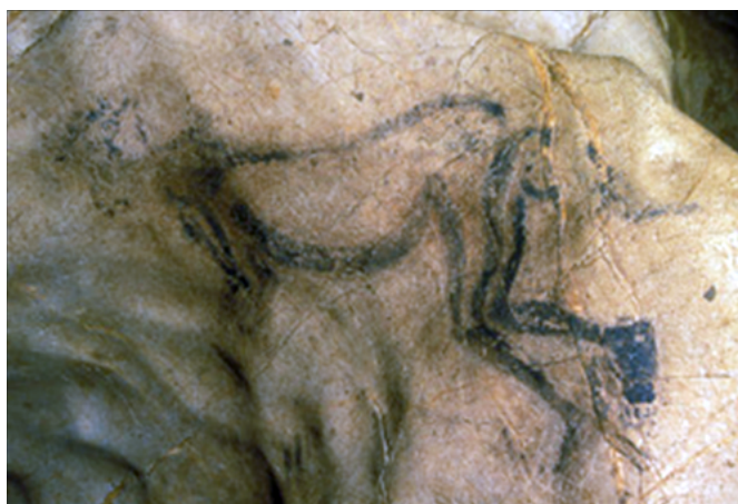
Czarownik, Jaskinia Trzech Braci (Les Trois Frères).

Do dziś malowidła i rytzy jaskiniowe paleolityczne wzbudzają zachwyt i odczucie pewniej tajemniczości i niezwykłości. Powstało też wiele teorii i interpretacji na ich temat. Jedną z nich interpretuje jaskinie jako najwcześniejsze sanktuaria (groty takie jak Lascaux czy Altamira są nazywane Kaplicą Sykstyńską paleolitu czy Luwrem pradziejowym) 22 . Można przypuszczać, że czas ich powstania był także okresem kształtowania się symbolicznych wartości, rozwoju systemów symbolicznej komunikacji oraz zdolności utrwalania wiedzy. Sądzi się, że przedstawienia paleolityczne są swego rodzaju rejestracją, zapisem opowieści mitycznych dawnych ludzi, które odzwierciedlają relację człowieka z środowiskiem i jego wierzenia. Malowidła i petroglify, zwłaszcza istot hybrydalnych, mających cechy zarówno ludzkie, jak i zwierzęce, często nazywanych „czarownikami”, mogą wskazywać na możliwość kontakt ludzi ze sferą nadprzyrodzoną, ze sferą kultu.