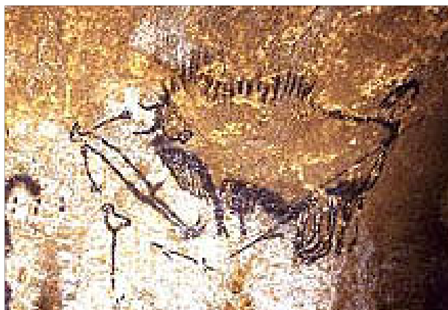
Studnia Martwego Człowieka, Lascaux.

z malowidłami i rytami jaskiniowymi jest dwójaki. Po pierwsze, sztuka ta powstała w grotach, które poprzez swoją ciasnotę i duszność mogły być używane jako środek osiągnięcia odmiennych stanów świadomości. Po drugie, korytarze jaskiń sprawiają wrażenie bycia w tunelu, które często jest motywem pojawiającym się w wizjach transowych. Ponadto ściany jaskiń były kojarzone jako granica pomiędzy światem duchów a światem ludzkim. Współczesne badania neuropsychologiczne wykazują różnorodność wizji transowych, demonstrują także zespół podobnych odczuć, jakich człowiek doznaje w odmiennym stanie świadomości. Są to: odczucie śmierci (oscylowanie na granicy światów), odczucie lotu (wrażenie wzlatywania lub opuszczania własnego ciała), odczucie transformacji (ludzko-zwierzęce), odczucie tonięcia bądź znajdowania się pod wodą (wchłonięcie), nadzwyczajna agresja lub wzmożone podniecenie seksualne. Wszystkie te wyrażenia można dostrzec na przedstawieniu w Studni Martwego Człowieka w grocie Lascaux: umierający (śmierć) falliczny (podniecenie) mężczyzna o ptasim dziobie (transmogryfikacja) w zestawieniu z zranionym i konającym żubrem (śmierć i agresja w postaci ogromnego zwierzęcia) oraz z motywem ptaka na kiju (lot-eksterioryzacja) 24 .