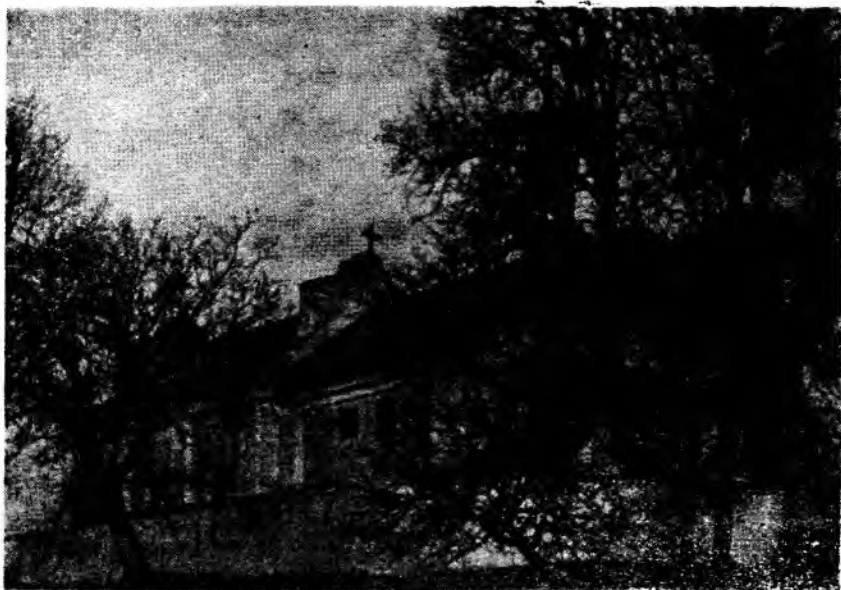
Czerniejów, kościół.

Nie zachował się żaden przekaz dający nam pełny, pierwotny wygląd kościoła. Biorąc jednak pod uwagę brak jakichkolwiek wzmianek o większych pracach przy obiekcie w siedmiu kolejnych wizytacjach i inwentarzach z lat 1644—1859, przy jednoczesnym powtarzaniu się w pewnych dokumentach części składowych budowli, można przypuszczać, że kościół w Czerniejowie składał się