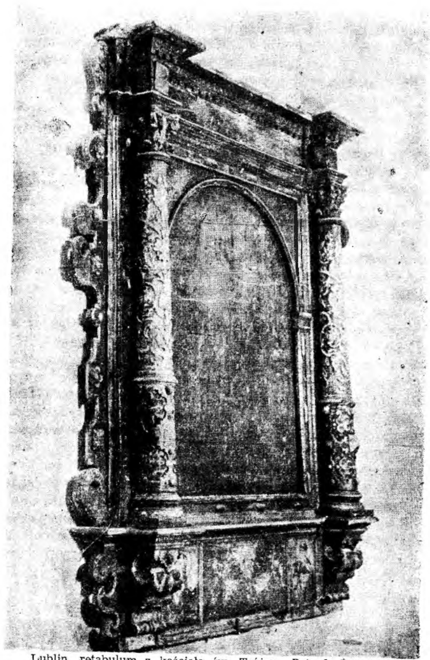
Lublin, retabulum z kościoła św. Trójcy.