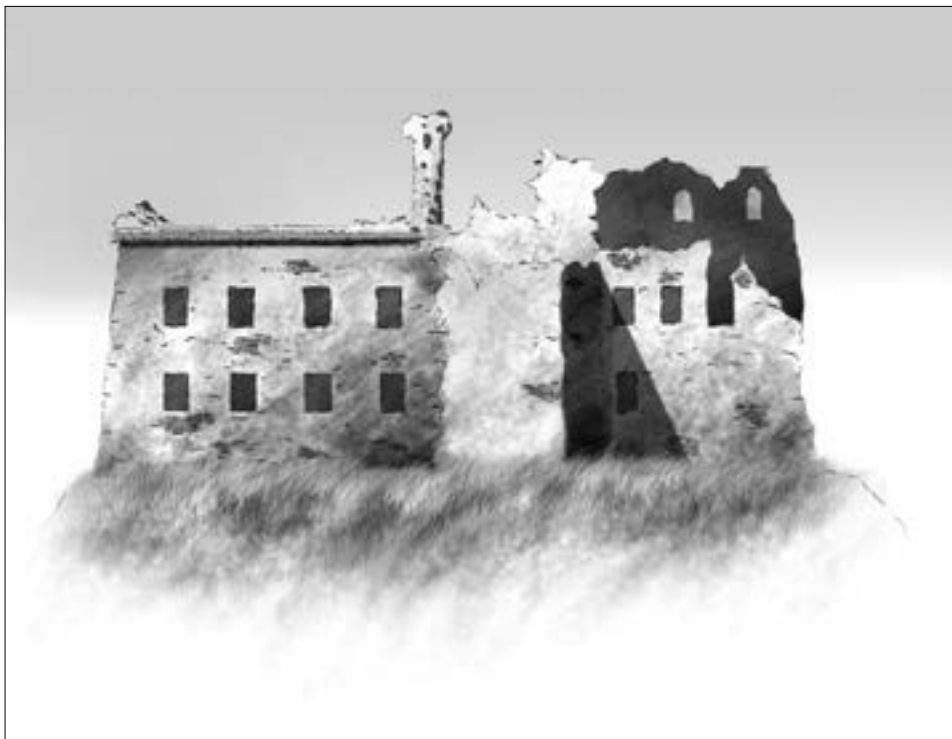
1. Widok na pałac na Czechowie na początku XIX wieku; autor M. Dudkiewicz wg: S.Z. Sierpiński, Obraz miasta...

Obraz Adama Lerue z dzieła Stronczyńskiego Opisy i widoki zabytków w Królestwie Polskiem 5 przedstawia tworzącą rozlewiska rzekę Czechówkę, widoczną od strony Wieniawy, oraz piaszczystą drogę prowadzącą od wiejskich chat na szczyt wzgórza z ruinami (il. 2). Stan pałacu jest podobny do tego zamieszczonego na rycinie Sierpińskiego. Samo wzgórze wygląda na bardziej wyrównane, a do pałacu przylegają drewniane budynki z wysokimi dachami, stanowiące być może folwark. Przed pałacem rozciąga się łąka z kilkoma drzewami.