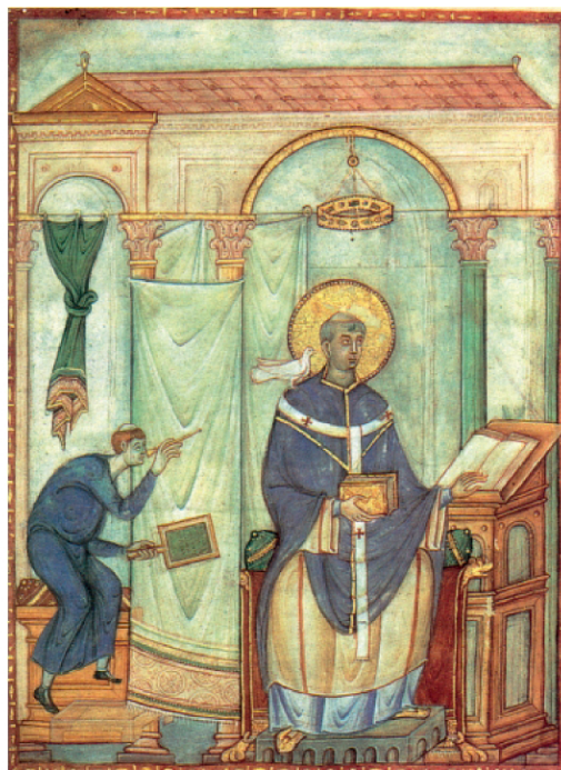
5. Grzegorz Wielki, Registrum Gregorii (Trewir, Stadtbibliothek, MS 171/1626)