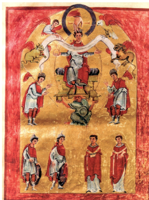
2. Otton III, Ewangeliarz Liutara , zwany akwizgrańskim (Aachen, Domschatz)