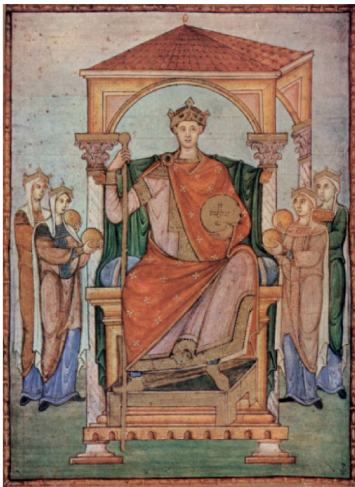
1. Otton II, Registrum Gregorii (Chantilly, Musée Condé, MS 14)