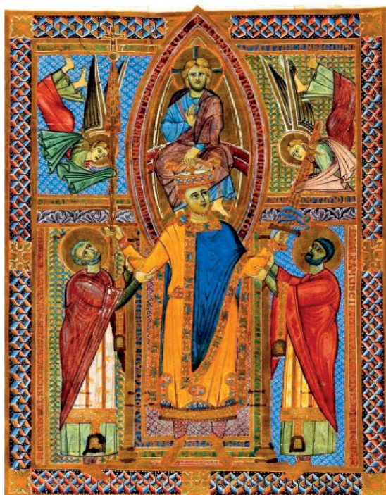
6. Chrystus koronujący Henryka II, 11r, Sakramentarz Henryka II, 1002-14 (Monachium Bayerische Staatsbibliothek, Clm. 4456)