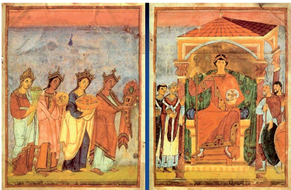
4. Otton III i personifikacje krain, 0v, 1r ewangeliarz (Bamberg, Staatsbibliothek, Class. 79)