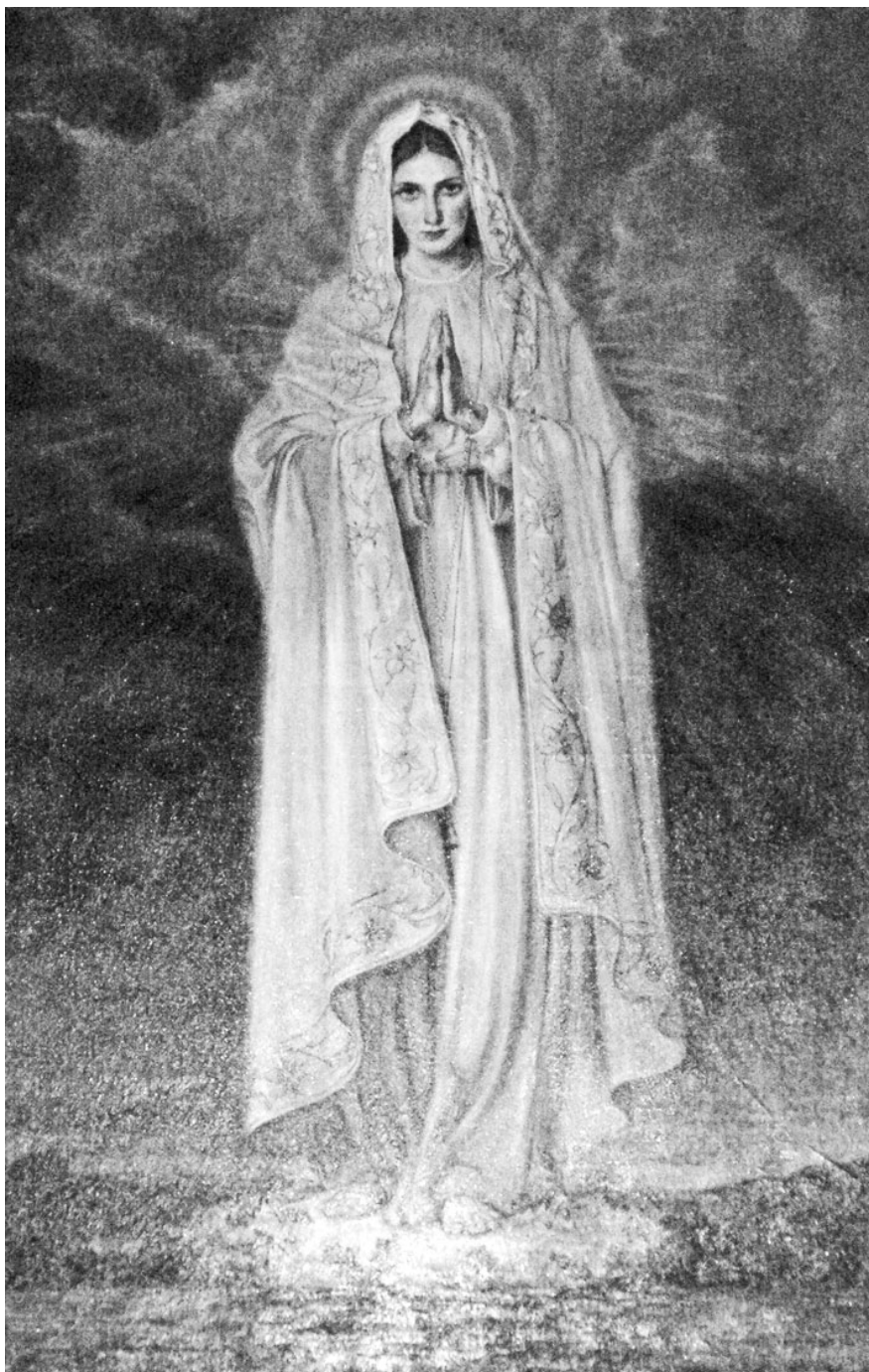
15. Adolf Hyla, Matka Boska Fatimska , olej na płótnie, 1956, Poznań, klasztor sióstr elżbietanek