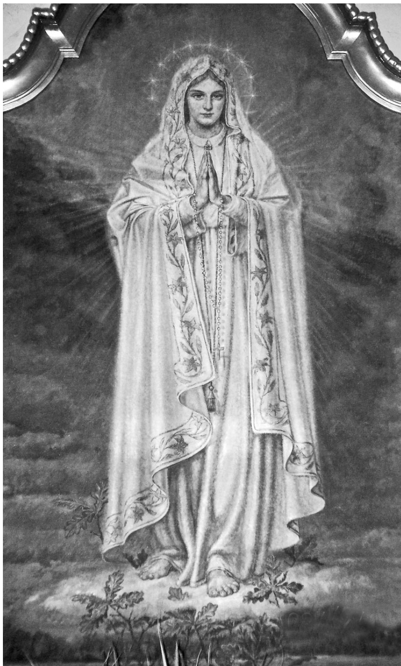
12. Adolf Hyla, Matka Boska Fatimska , olej na płótnie, 1954, Dąbrowa k. Niemodlina, parafia św. Wawrzyńca