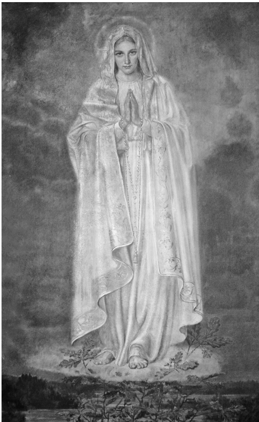
11. Adolf Hyla, Matka Boska Fatimska , olej na płótnie, 1954, Gliwice, parafia św. Michała Archanioła