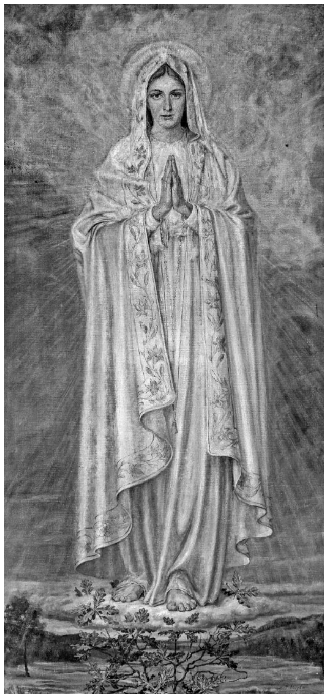
16. Adolf Hyla, Matka Boska Fatimska , olej na płótnie, 1957, Ostrołęka, kościół pw. św. Wojciecha Biskupa