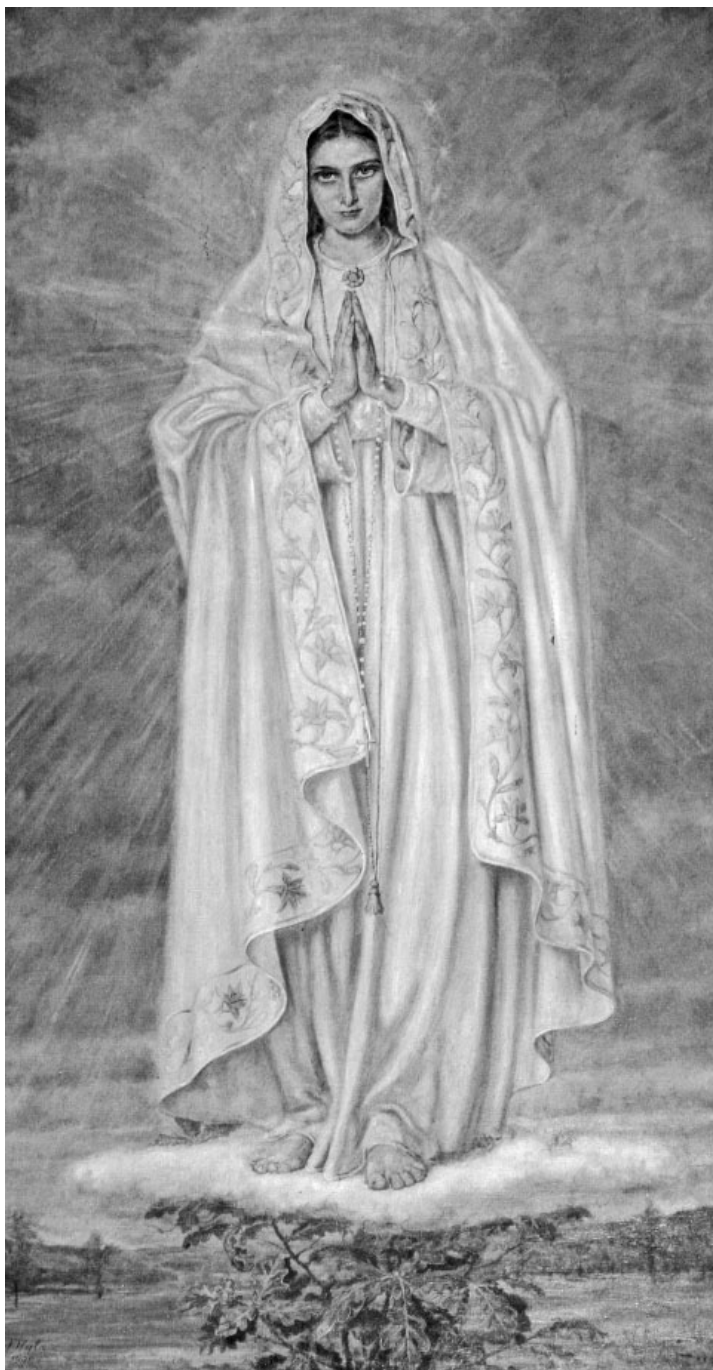
5. Adolf Hyla, Matka Boska Fatimska , olej na płótnie, 1950, Rybna, kościół parafialny pw. św. Kazimierza