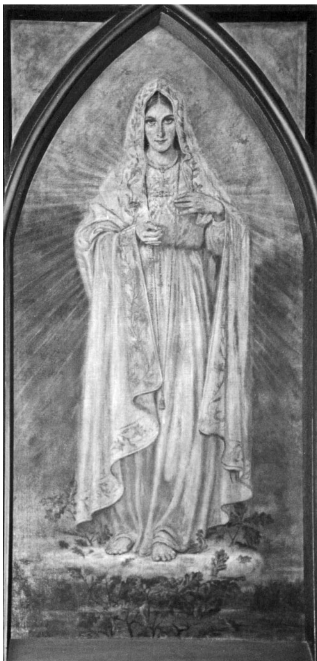
10. Adolf Hyla, Matka Boska Fatimska , olej na płótnie, 1954, Ruda Śląska-Wirek, kościół parafialny pw. św. Wawrzyńca i św. Antoniego