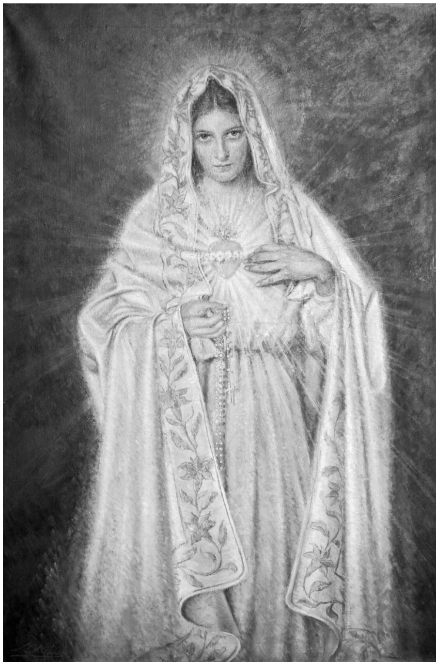
1. Adolf Hyla, Matka Boska Fatimska , olej na płótnie, 1948, Sędziszów Małopolski, kościół parafialny pw. św. Antoniego z Padwy