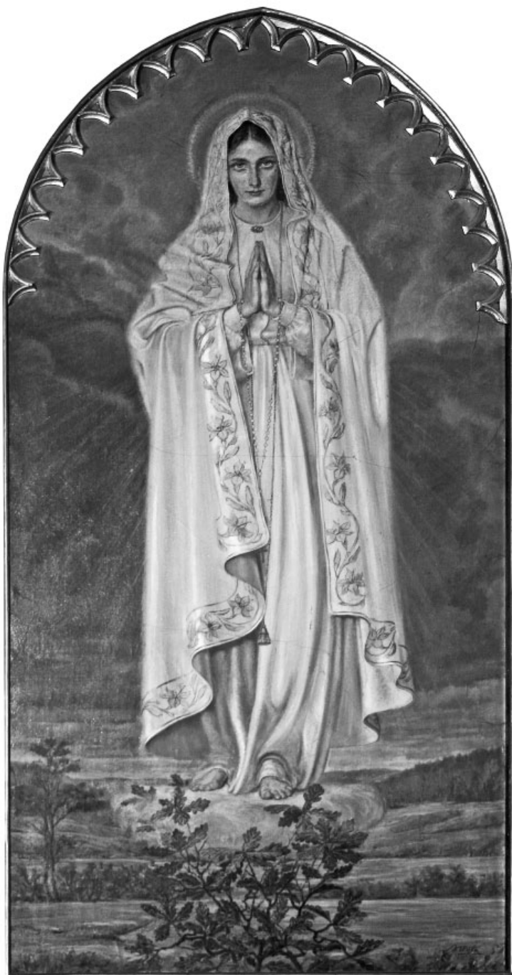
13. Adolf Hyla, Matka Boska Fatimska , olej na płótnie, 1955, Szczurowa, kościół parafialny pw. św. Bartłomieja Apostoła