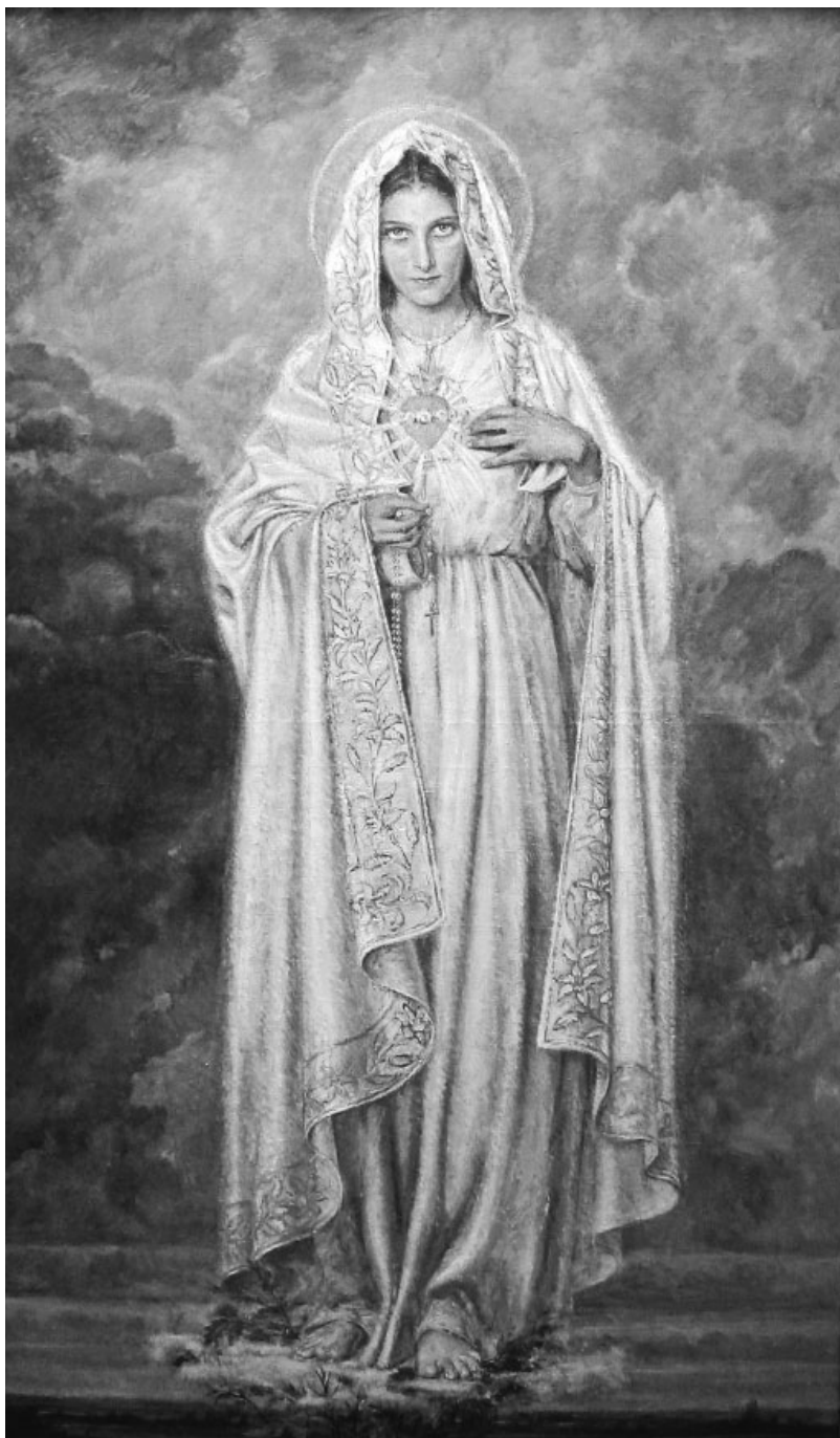
3. Adolf Hyla, Matka Boska Fatimska , olej na płótnie, 1949, Kraków, bursa dla studentek sióstr sercanek