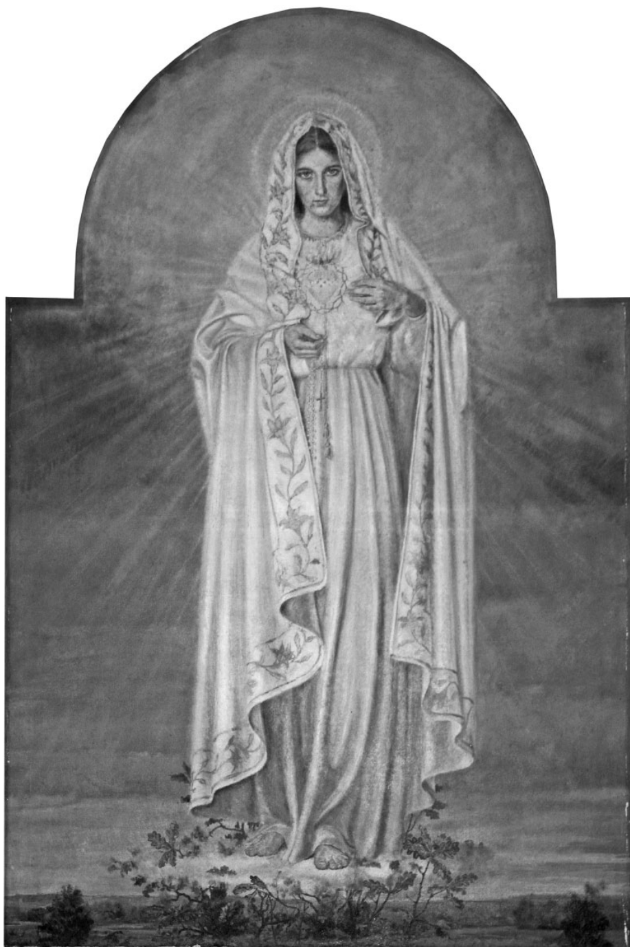
9. Adolf Hyla, Matka Boska Fatimska , olej na płótnie, 1953, Żyraków, parafia Trójcy Przenajświętszej