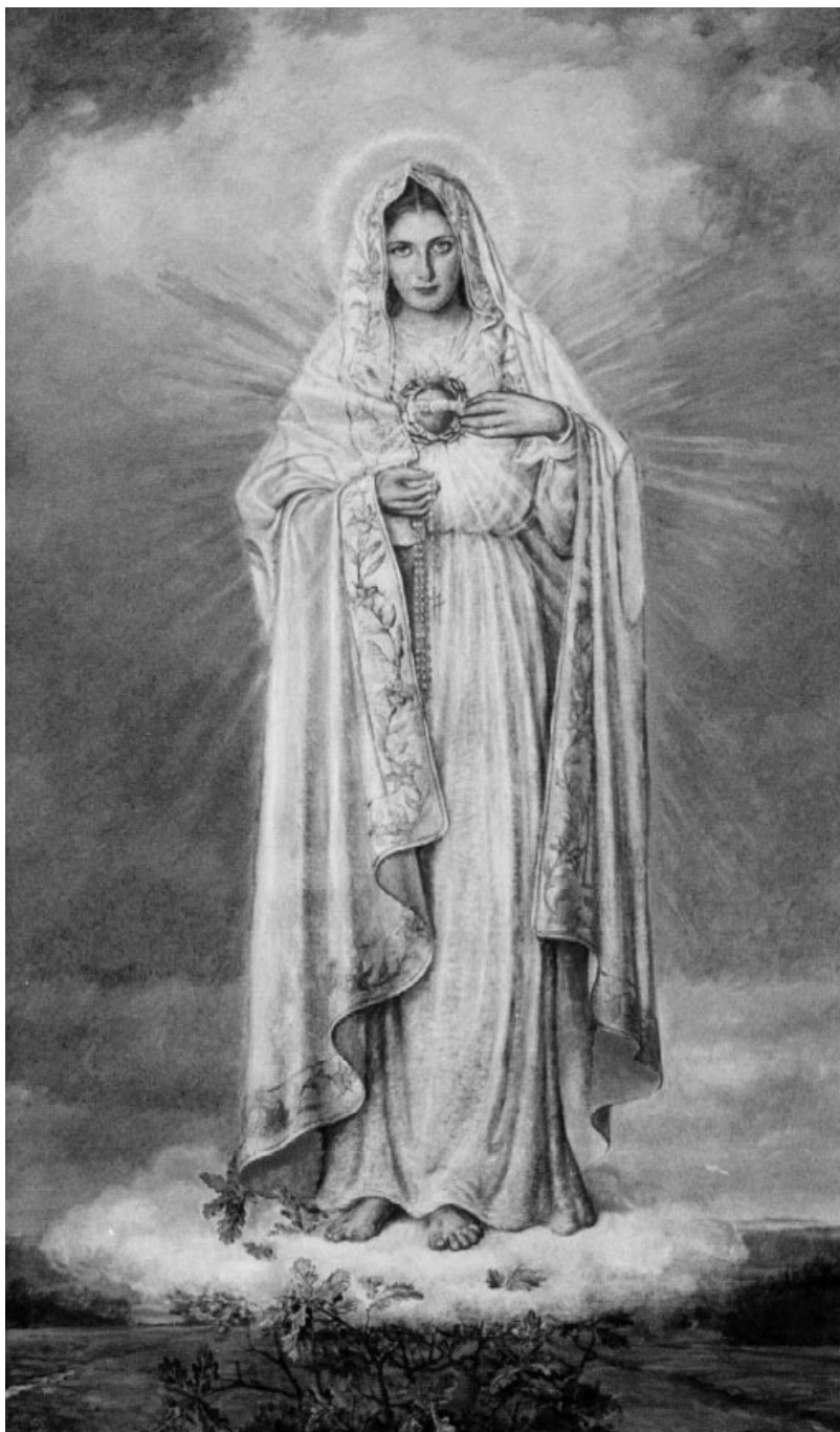
6. Adolf Hyla, Matka Boska Fatimska , olej na płótnie, 1951, Luboszyce, kościół parafialny pw. św. Antoniego