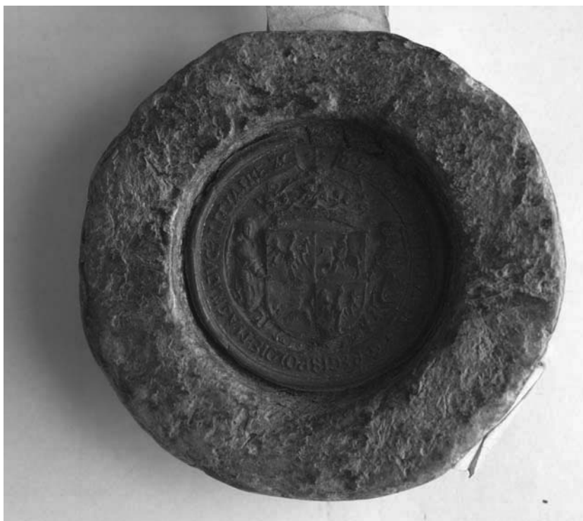
AGAD, Zbiór dokumentów pergaminowych, sygn. 4460; Kraków 5 XI 1515: pieczęć mniejsza korona

Petrus episcopus et vicecancellarius subscripsit