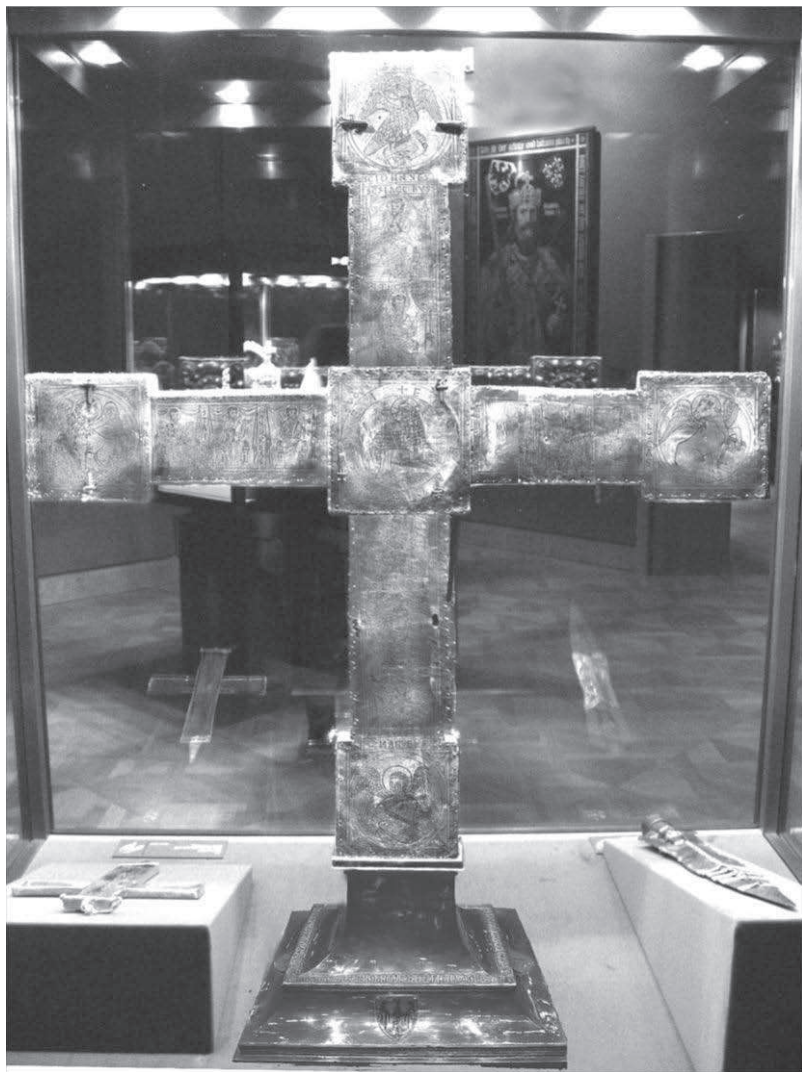
4. Krzyż Rzeszy, X/XI w. Wiedeń, Schatzkammer