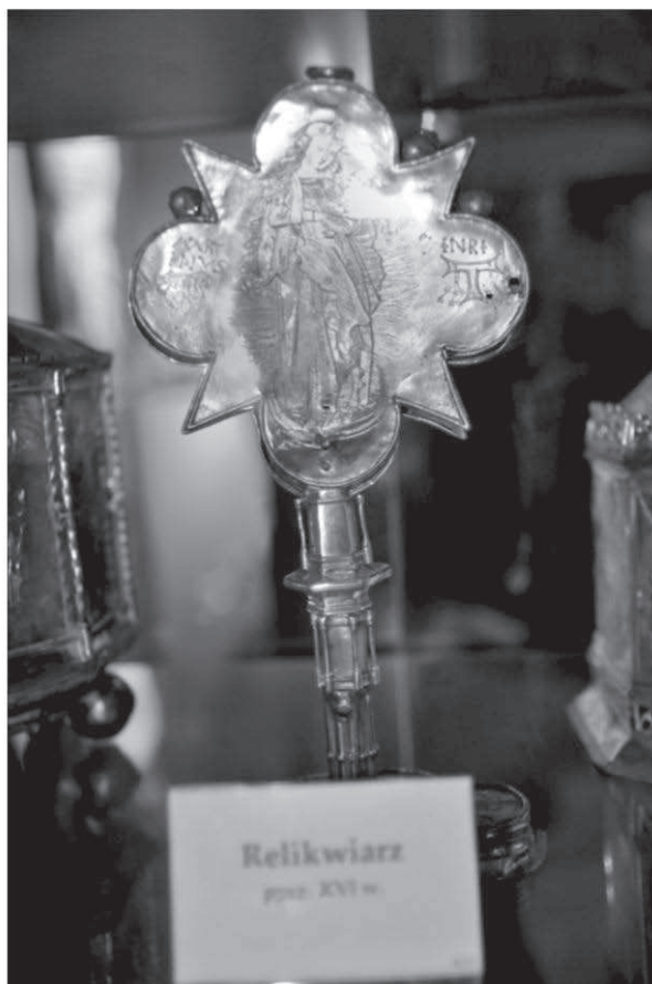
3. Relikwiarz z pocz. XVI w. Poznań, Muzeum Archidiecezjalne