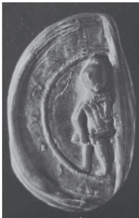
2. Pieczęć Władysława Hermana, 2. poł. XI w.