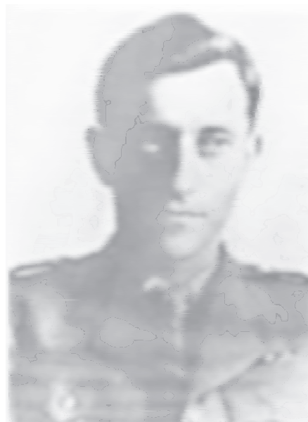
Roman Zambrowski (właśc. Rubin Nussbaum), przewodniczący Komisji Specjalnej w latach 1945-1954 http://pl.wikipedia.org/wiki/ Roman_Zambrowski [dostęp: 2008.02.25].