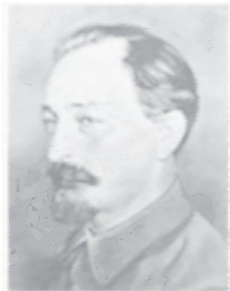
Feliks Dzierżyński, przewodniczący WCzK w latach 1917-1926 ( Encyklopedia powszechna PWN , 2004)

Lenina potwierdziła rzeczywistość. „Ojcem duchowym” Wszechrosyjskiej Nadzwyczajnej Komisji do Walki z Kontrrewolucją, Spekulacją i Sabotażem był Polak – Feliks Dzierżyński 47 , a polskiej Komisji Specjalnej do Walki z Nadużyciami i Szkodnictwem Gospodarczym – Żyd Rubin Nussbaum 48 , występujący pod niezwykle polskobrzmiącym nazwiskiem Roman Zambrowski, mylącym do tego stopnia, że ówczesne społeczeństwo polskie postrzegało go nie tylko jako „Polaka”, ale nawet jako „szlachcica” polskiego, który „chce kołchozów, aby zniszczyć [polskich] chłopów” 49 .