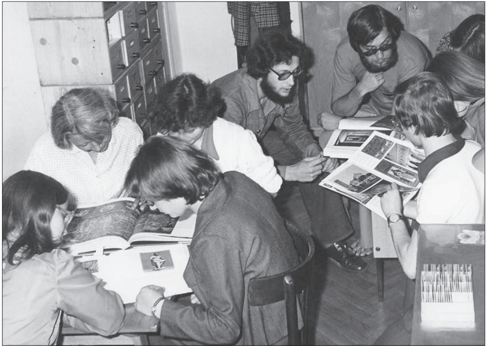
15. Studenci w Lektorium przed egzaminem, lata 70.