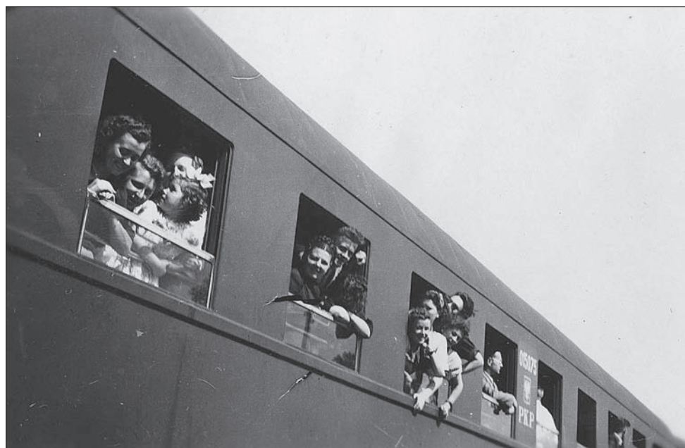
4. Wyjazd studentów historii sztuki na objazd naukowy, lata 50.