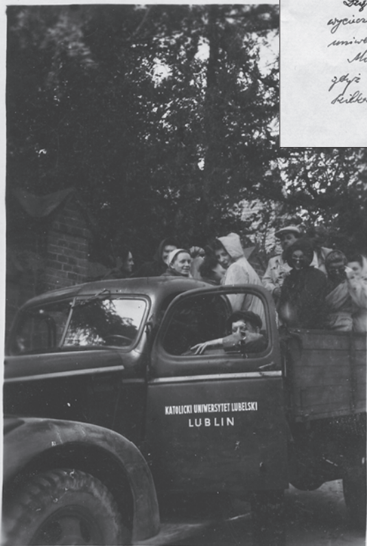
2. Objazd naukowy, lata 50.