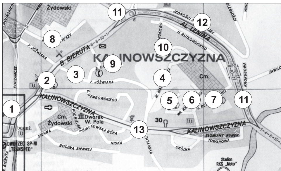
Plan 3. Nazwy ulic na osiedlu XXX-lecia PRL