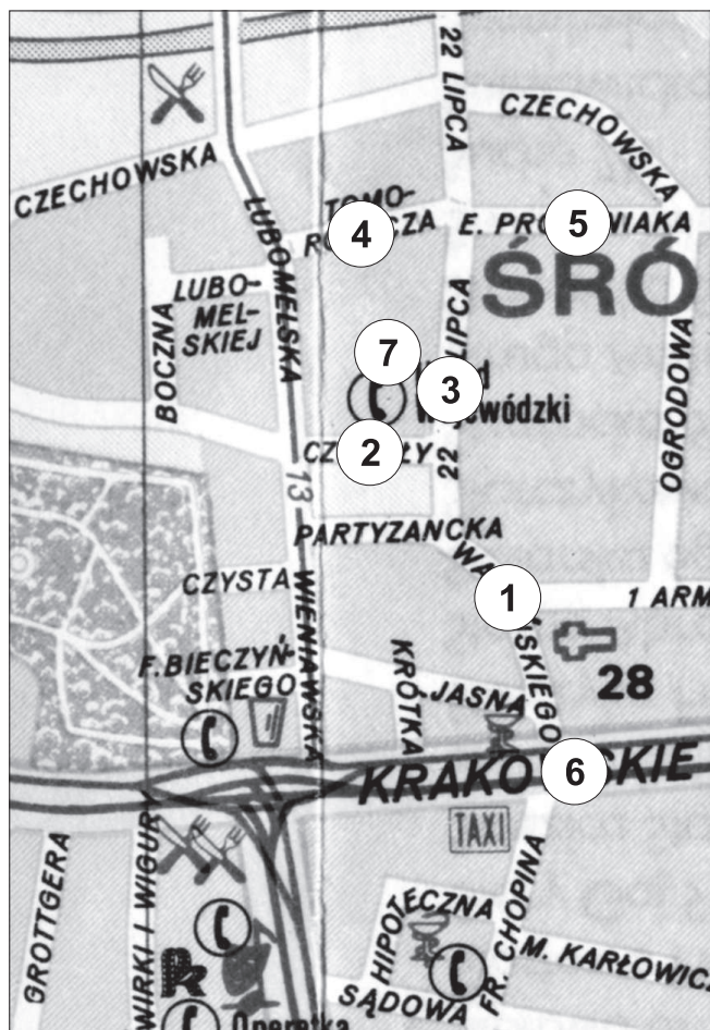
Plan 2. Nazwy ulic wokół Urzędu Wojewódzkiego w Lublinie w okresie PRL-u