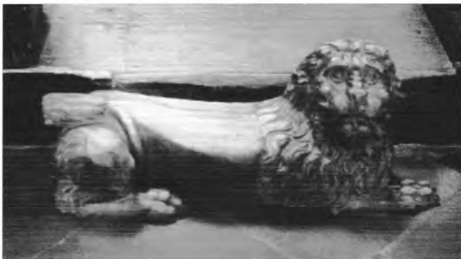
9. Drewniana rzeźba lwa w kolegiacie p.w. Najświętszego Zbawiciela i Wszystkich Świętych w Dobrym Mieście