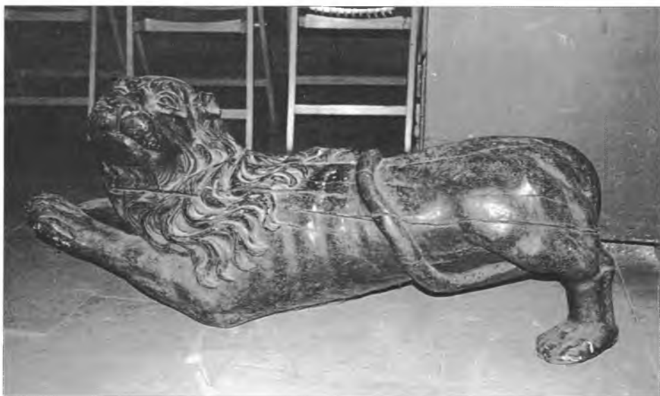
7, 8. Drewniane rzeźby lwów w klasztorze. Cystersów w Krakowie-Mogile