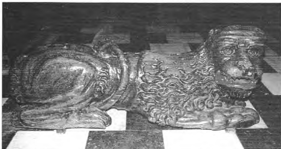
6. Drewniana rzeźba lwa w kościele p.w. Wniebowzięcia NMP i św. Stanisława bpa męczennika w Szczyrzycu