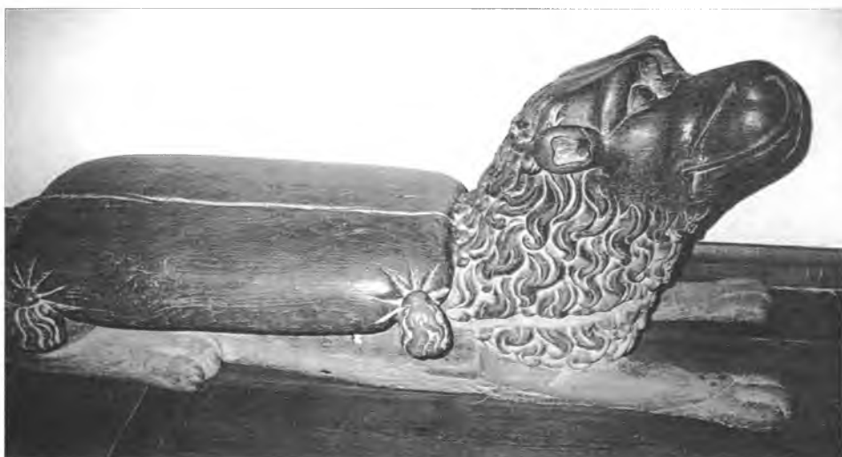
1, 2. Drewniane rzeźby lwów w pocysterskim kościele p.w. Panny Marii i św. Floriana w Koprzywnicy