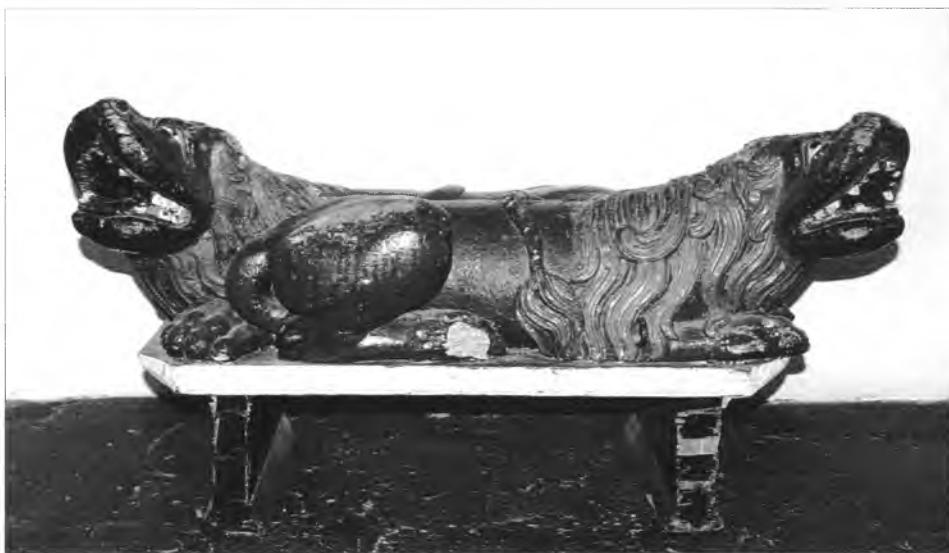
10. Drewniana rzeźba lwa w muzeum klasztornym. Bernardynów w Leżajsku