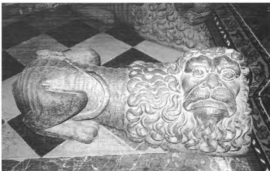
3, 4. Drewniane rzeźby lwów w pocysterskim kościele p.w. Panny Marii i św. Tomasza Kantuaryjskiego w Sulejowie