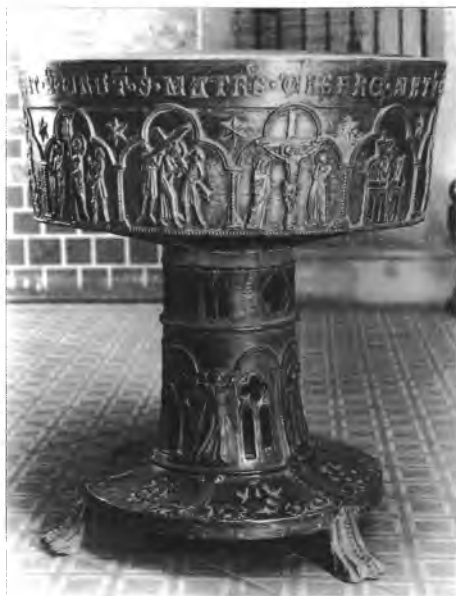
7. Chrzcielnica brązowa w kościele par. p.w. świętych Piotra i Pawła w Legnicy