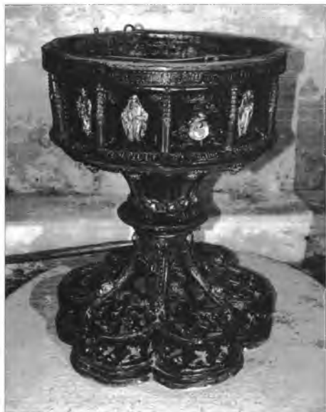
1. Chrzcielnica brązowa w kościele par. p.w. NM Panny w Banskjej Bystricy