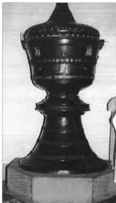
4. Chrzcielnica brązowa w Spiskiej Beli