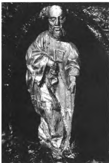
9. Chrzcielnica brązowa w kościele par. p.w. NM Panny w Banskiej Bystricy, fragment