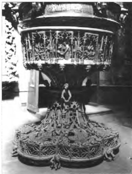
8. Chrzcielnica brązowa z kościoła par. p.w. św. Elżbiety we Wrocławiu