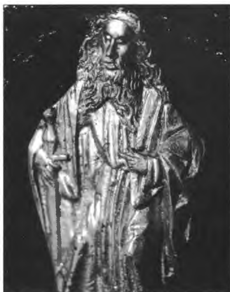
10. Chrzcielnica brązowa w kościele par. p.w. NM Panny w Banskiej Bystricy, fragment