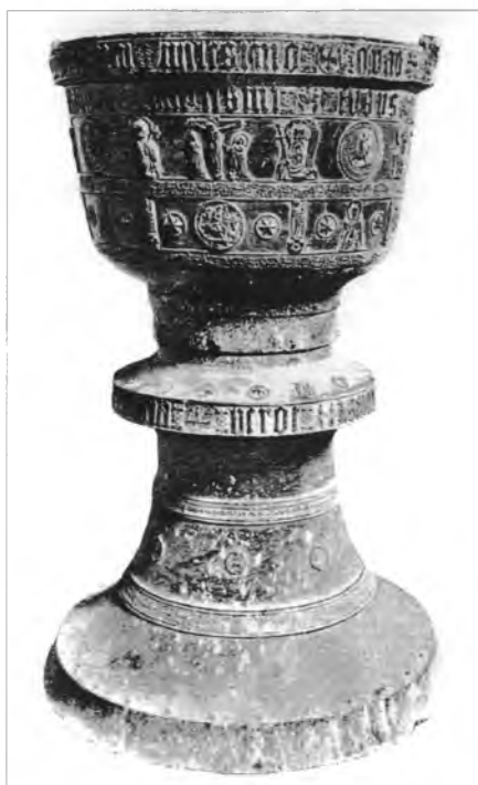
3. Chrzcielnica brązowa w Ruskinowcach