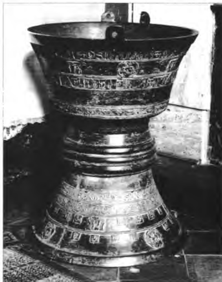
2. Chrzcielnica brązowa w Matejowcach