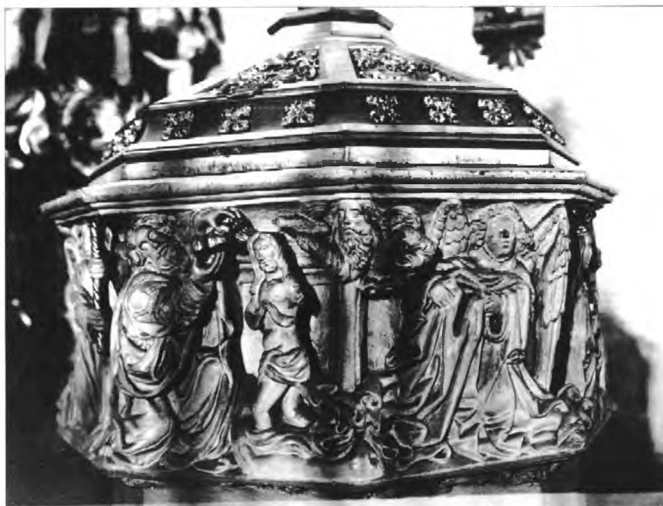
6. Chrzcielnica kamienna w kościele par. p.w. NM Panny na Piasku we Wrocławiu, fragment