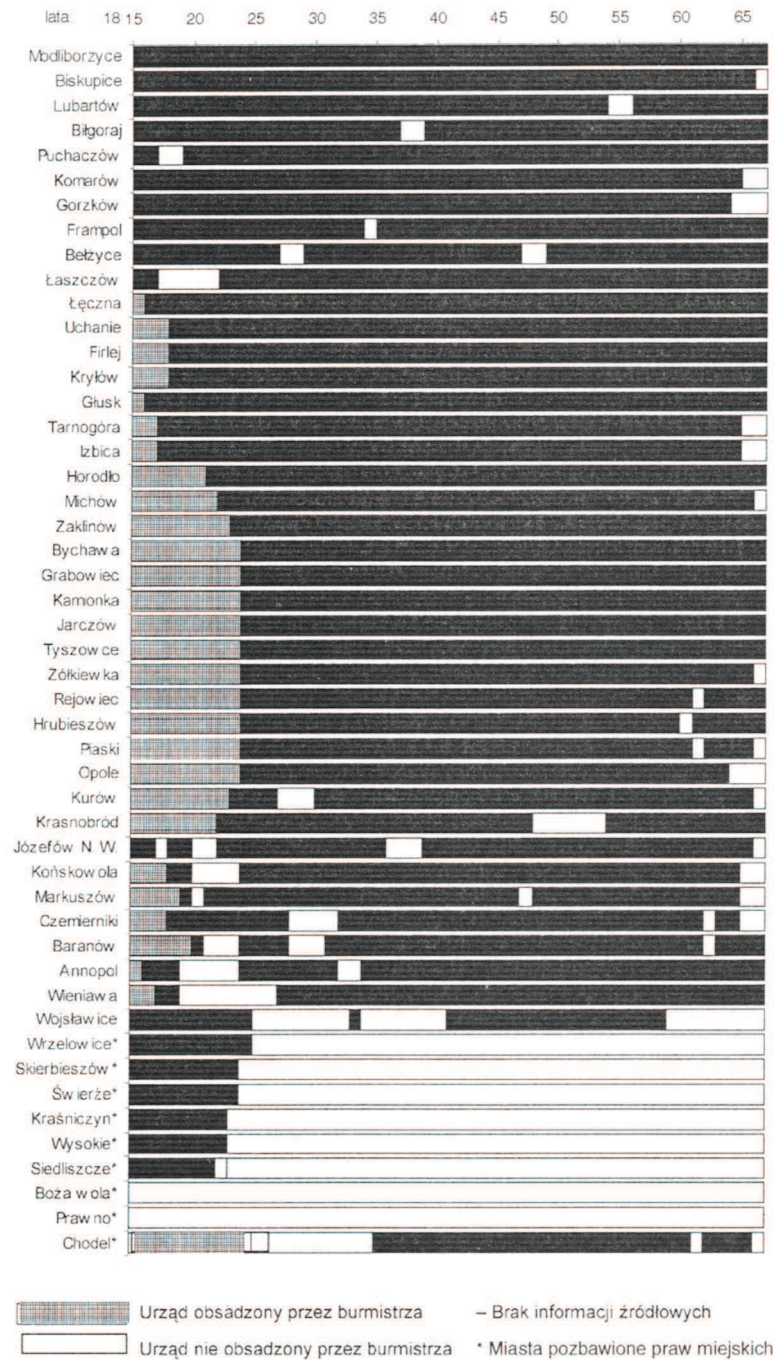
Wykres 2. Obsada urzędu burmistrza w miastach prywatnych województwa (guberni) lubelskiego w latach 1815-1867