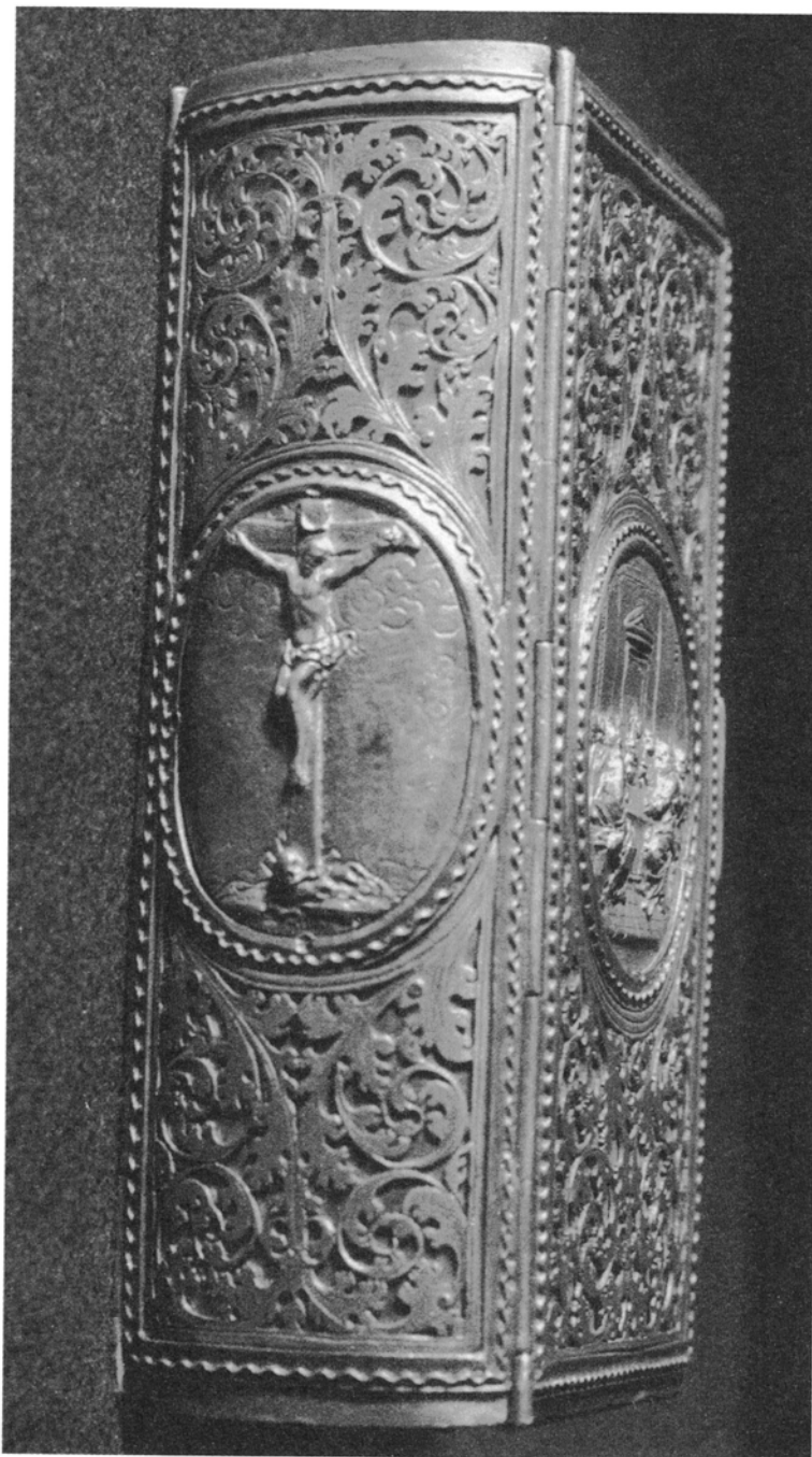
3. Oprawa Ewangeliarza ze sceną Ukrzyżowania (grzbiet oprawy).