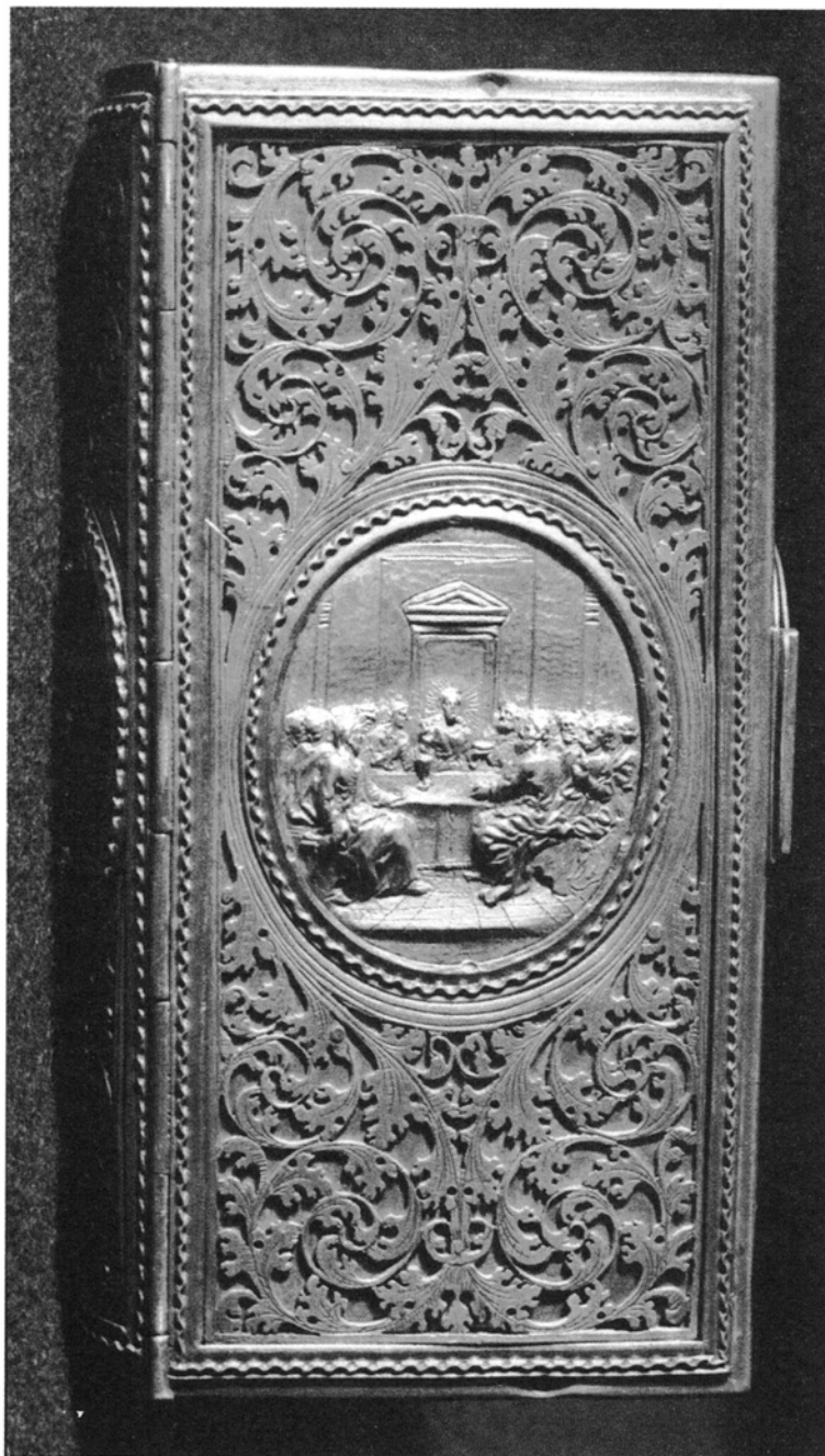
1. Oprawa Ewangeliarza ze sceną Ostatniej Wieczerzy (rewers oprawy).