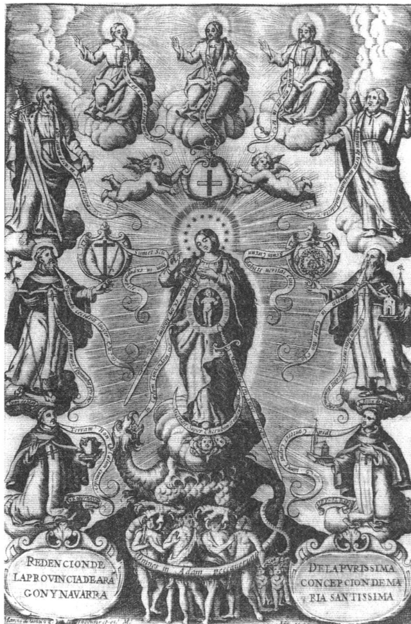
12. Marcos Orozco, Apoteoza Niepokalanego Poczęcia , miedzioryt, 1655