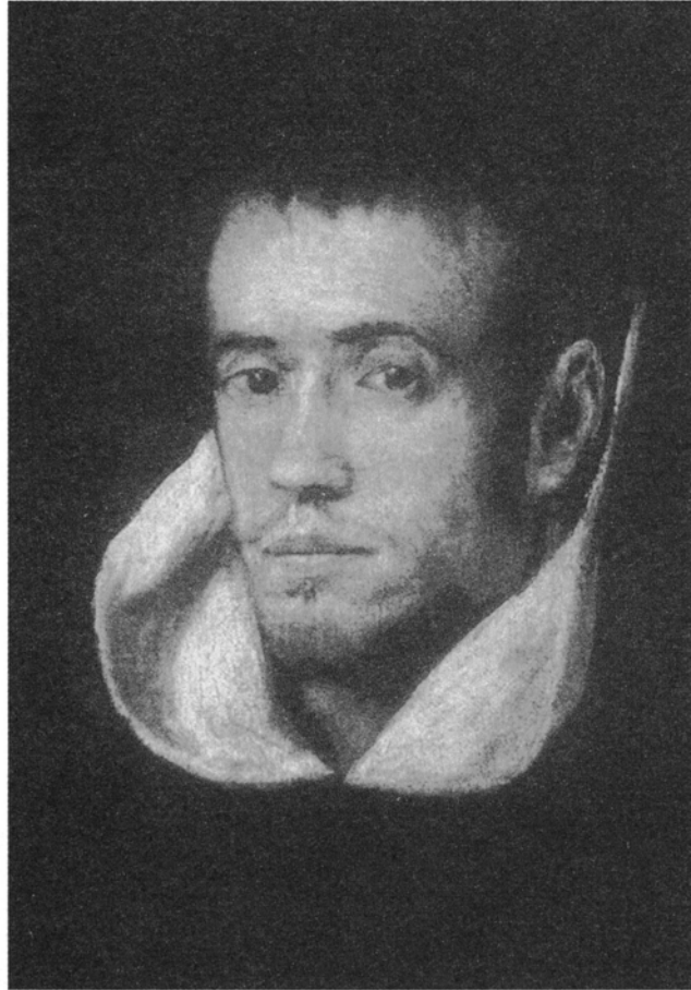
5. El Greco, Jan Chrzczciel de la Concepción , olej na płótnie, 1611, Madryt, Museo del Prado