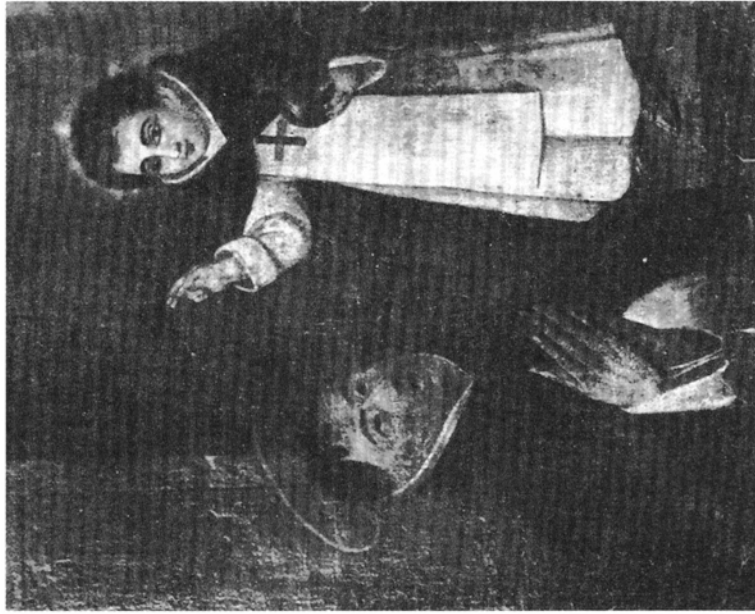
1. Jerónimo de S. Miguel, San Chirzicziel de la Concepción , olej na płótnie, 1610, Kordowa, kościół trzynitarzy bosych