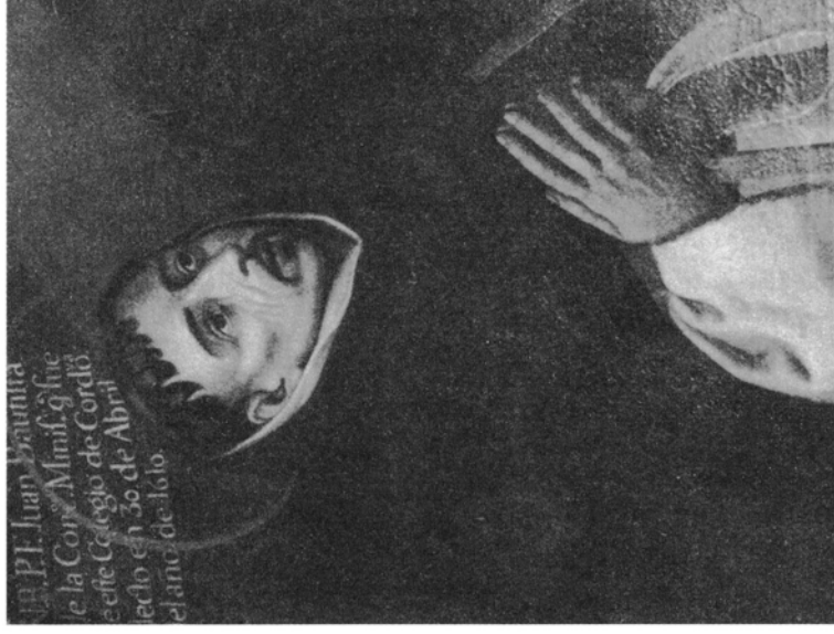
2. Jan Chirzicziel de la Concepción, olej na płótnie , przed 1650, Kordowa, kościół trzynitarzy bosych, fot. A. Witko