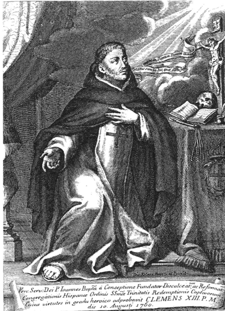
9. Giovanni Battista Sintes (wg rysunku Giovanniego Velaso). Jan Chrzcziciel de la Concepción, miedzioryt, 1733, fot. archiwum autora