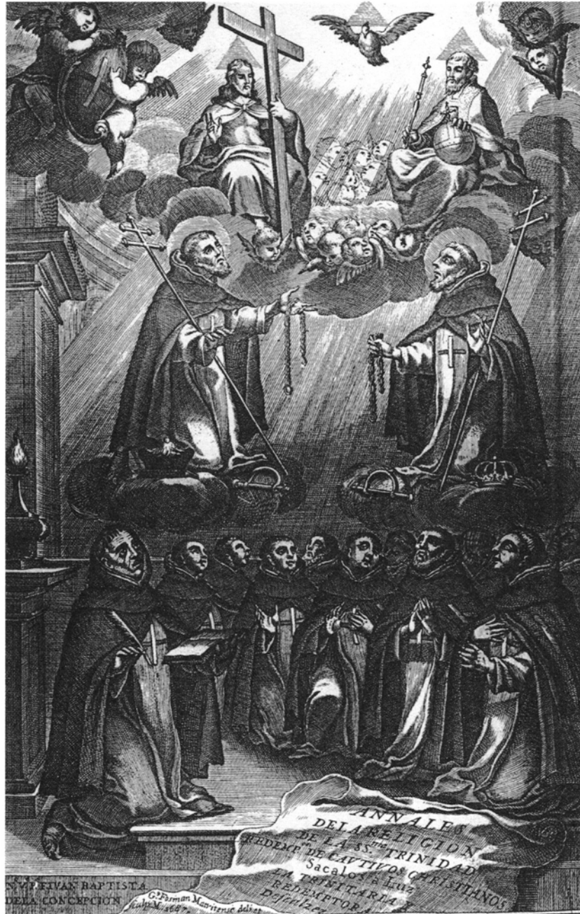
13. Gregorio Fosman y Medina, Apoteoza Zakonu trynitaraskiego , miedzioryt, 1687