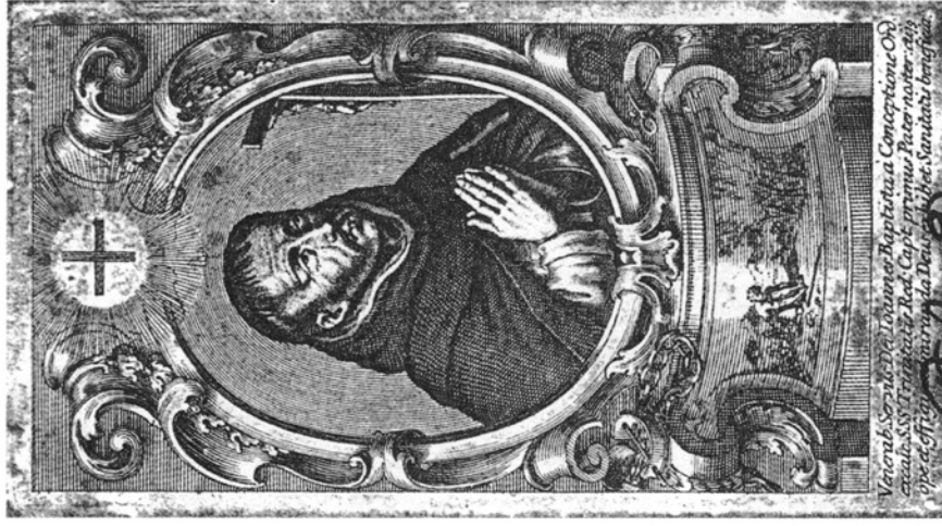
4. Johann Andreas Pfeffel sen.(?), Jan Chrzczciel de la Concepcion , miedzioryt, 1715