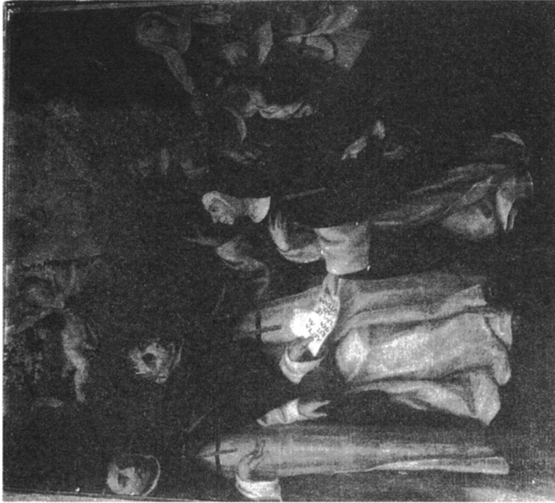
7. Jan Chrzcziciel de la Concepcion wręcza Regule trynitarkom bosym , olej na płótnie, koniec XVII w., Madryt, klasztor trynitarek bosych