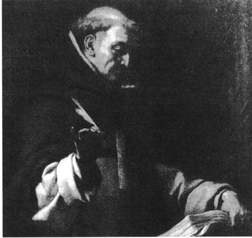
14. Vicente Carducho. San Juan Bautista de la Concepción, olej na płótnie, 1632-1638, Toledo, Museo de Santa Cruz