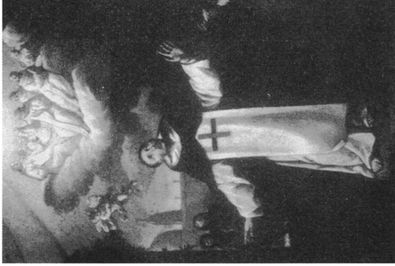
8. Wizja Jana Chrzcziciela de la Concepcion , olej na płótnie, 2. poł. XVII w., Rzym, kościół San Carlino alle Quattro Fontane