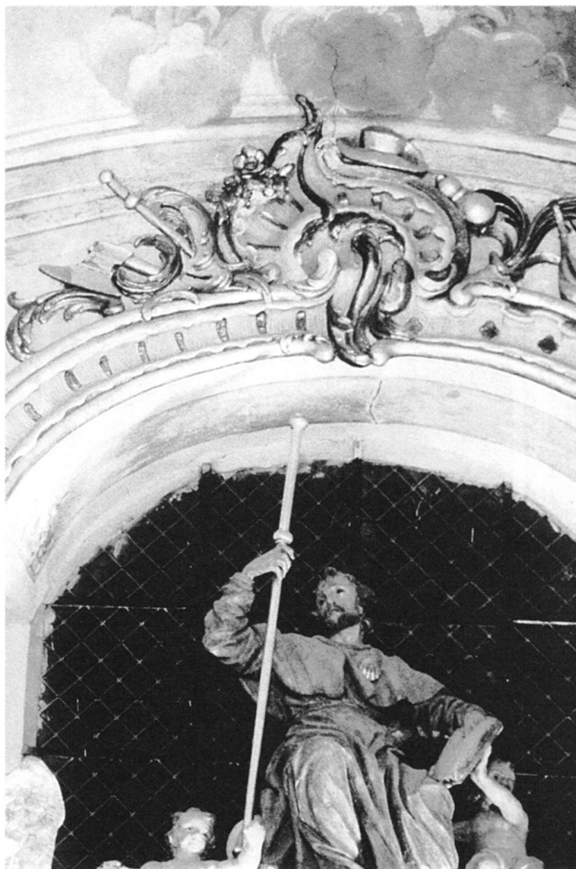
12. Obra, kościół św. Jakuba Większego Apostoła, Św. Jakub , figura kamienna nad ołtarzem głównym, XVIII w.