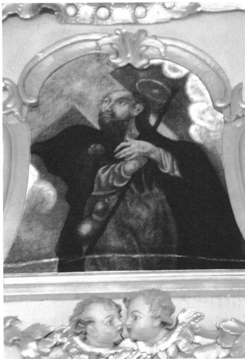
4. Budziszewko, kościół św. Jakuba Większego Apostoła, Św. Jakub , obraz nad ołtarzem głównym, olej na płótnie, pocz. XVIII w.