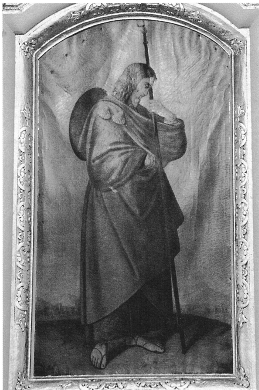
1. Czermin, kościół św. Jakuba Większego Apostoła, Św. Jakub , ołtarz w transepcie północnym, olej na płótnie, kon. XVIII w.