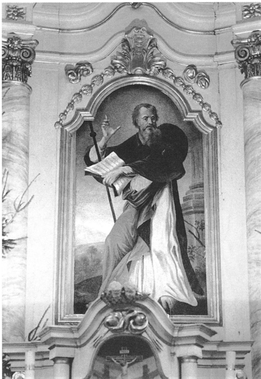
6. Świąciechowa. kościół św. Jakuba Większego Apostoła, Św. Jakub , obraz w ołtarzu głównym na zasuwie, olej na płótnie, kon. XVIII w.