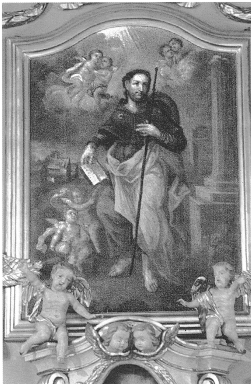
15. Żabno, kościół św. Jakuba Większego Apostoła. Św. Jakub , obraz w ołtarzu głównym, olej na płótnie, XVIII w.