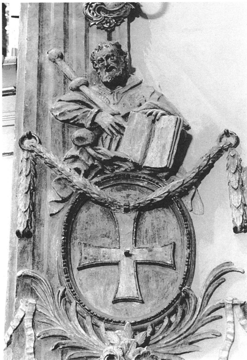
13. Obra, kościół św. Jakuba Większego Apostoła, Św. Jakub, zacheuszek na filarze nawy, XVIII w.