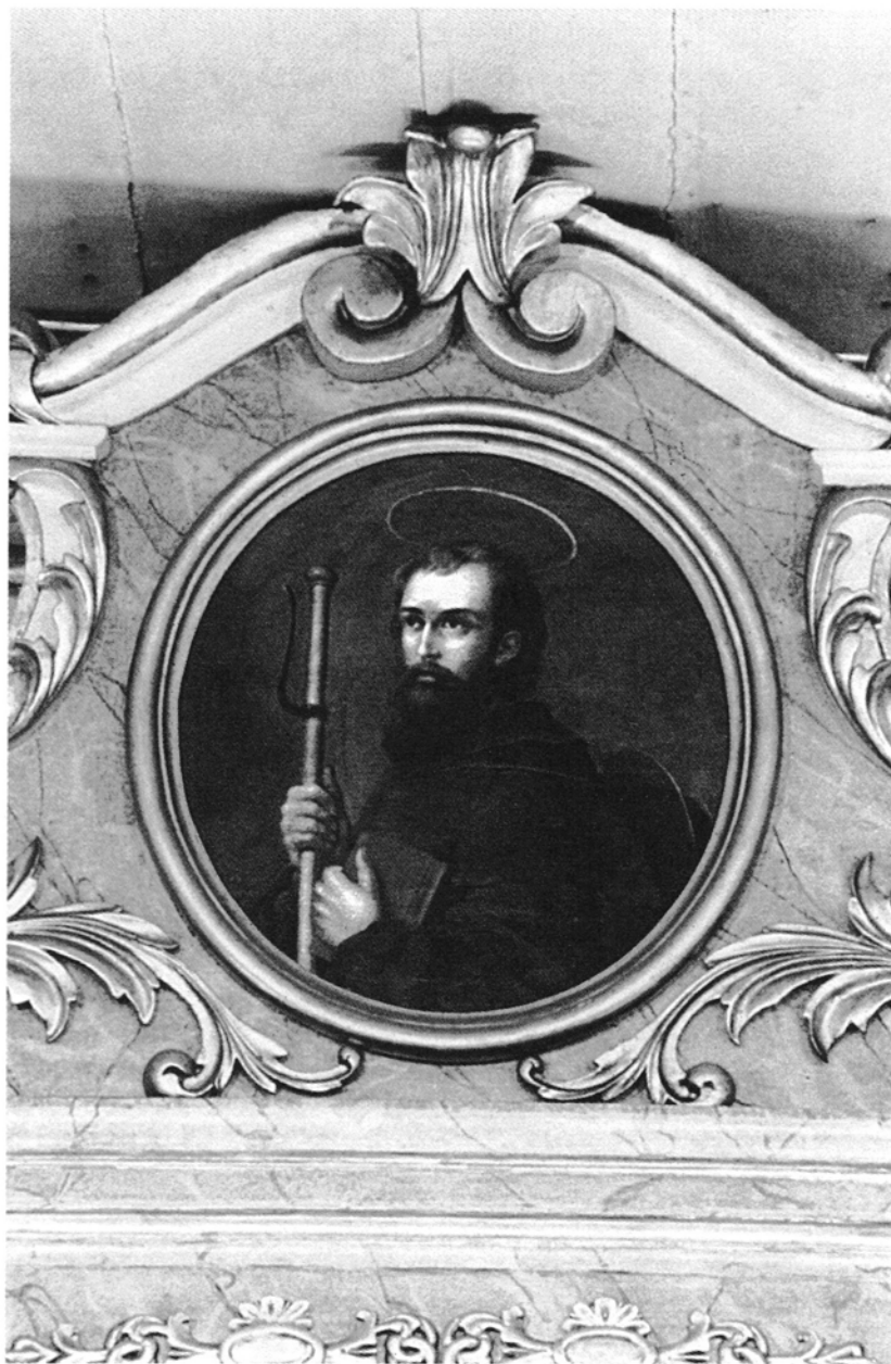
2. Tłocinia, kościół św. Jakuba Większego Apostoła, Św. Jakub , obraz nad ołtarzem głównym, olej na płótnie, kon. XVIII w.