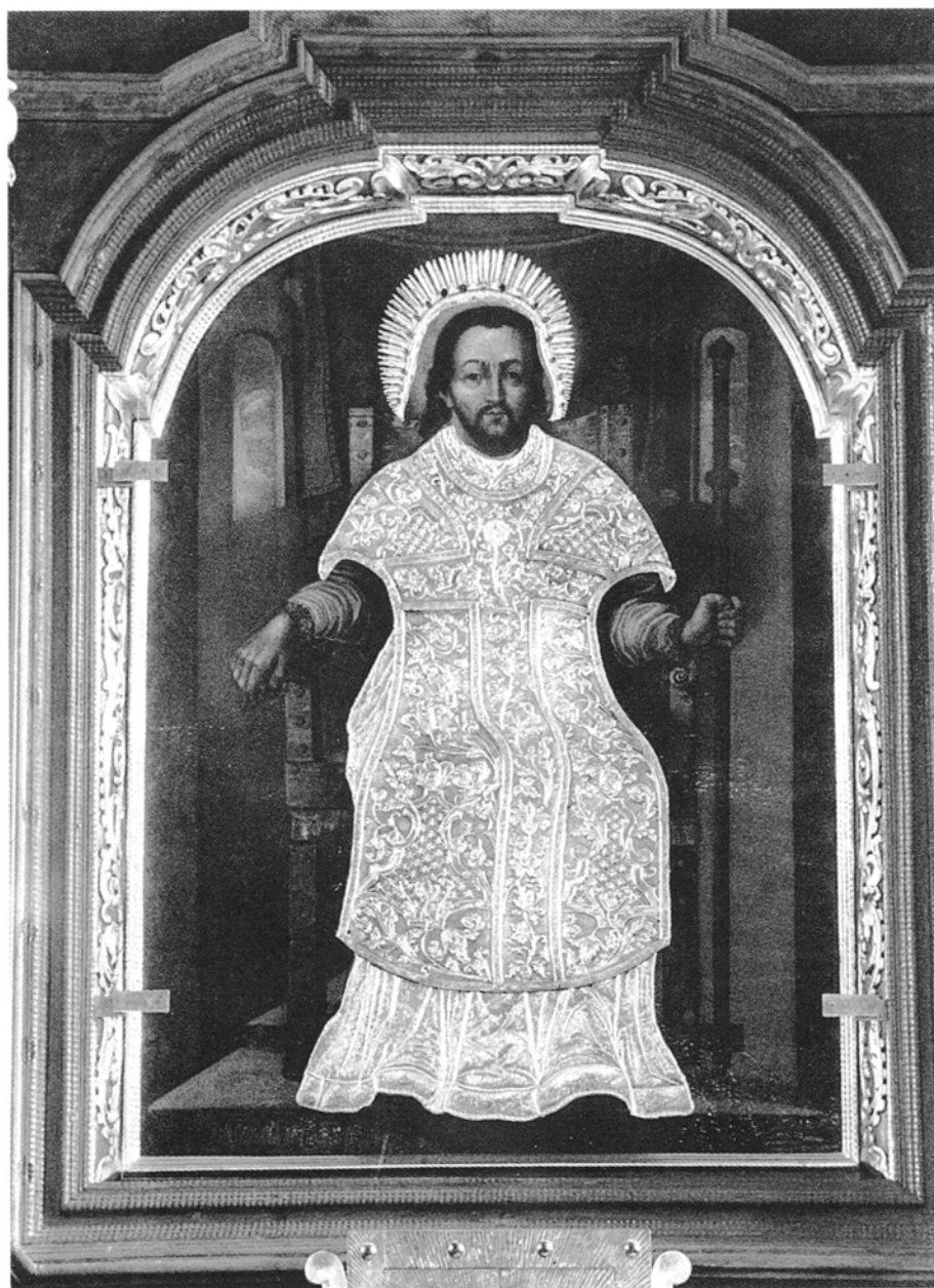
11. Murowana Goślina, kościół św. Jakuba Większego Apostoła. Św. Jakub , szkoła hiszpańska, obraz w oltarzu głównym, olej na płótnie, 1683 r.