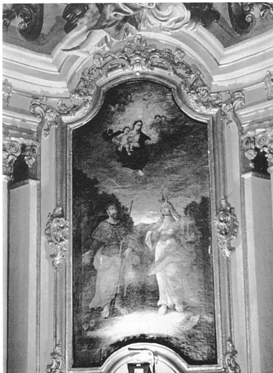
9. Lusowo, kościół św. Jakuba Większego Apostoła i św. Jadwigi Śląskiej. Św. Jakub Większy Apostoł i Św. Jadwiga Śląska , obraz w ołtarzu południowym (dawny ołtarz główny), olej na płótnie, 1776-1780 r.