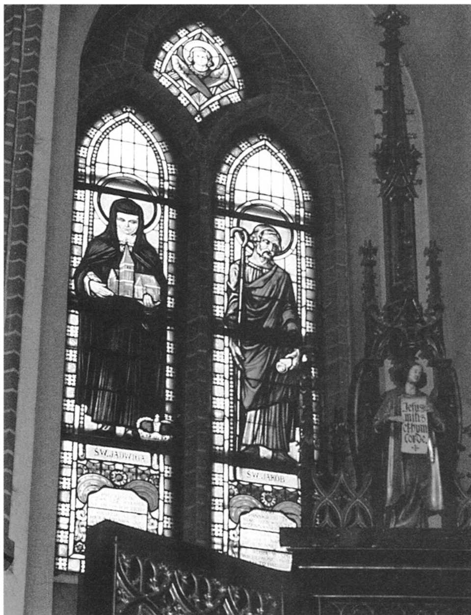
10. Lusowo, kościół św. Jakuba Większego Apostoła i św. Jadwigi Śląskiej. Św. Jakub i Św. Jadwiga Śląska, witraż w prezbiterium, 1916-1918 r.