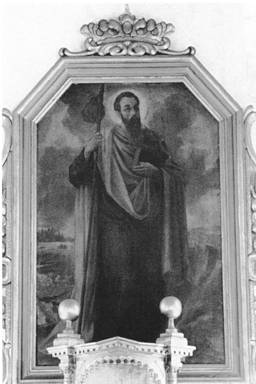
14. Sobiałkowo, kościół św. Jakuba Większego Apostoła, Św. Jakub , obraz w ołtarzu głównym, olej na blasze cynowej, XX w.