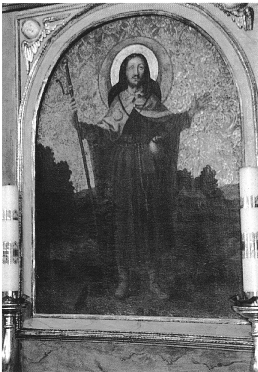
3. Błazejewo, kościół św. Jakuba Większego Apostoła, Św. Jakub , obraz w kaplicy południowej, olej na płótnie, XVII w.