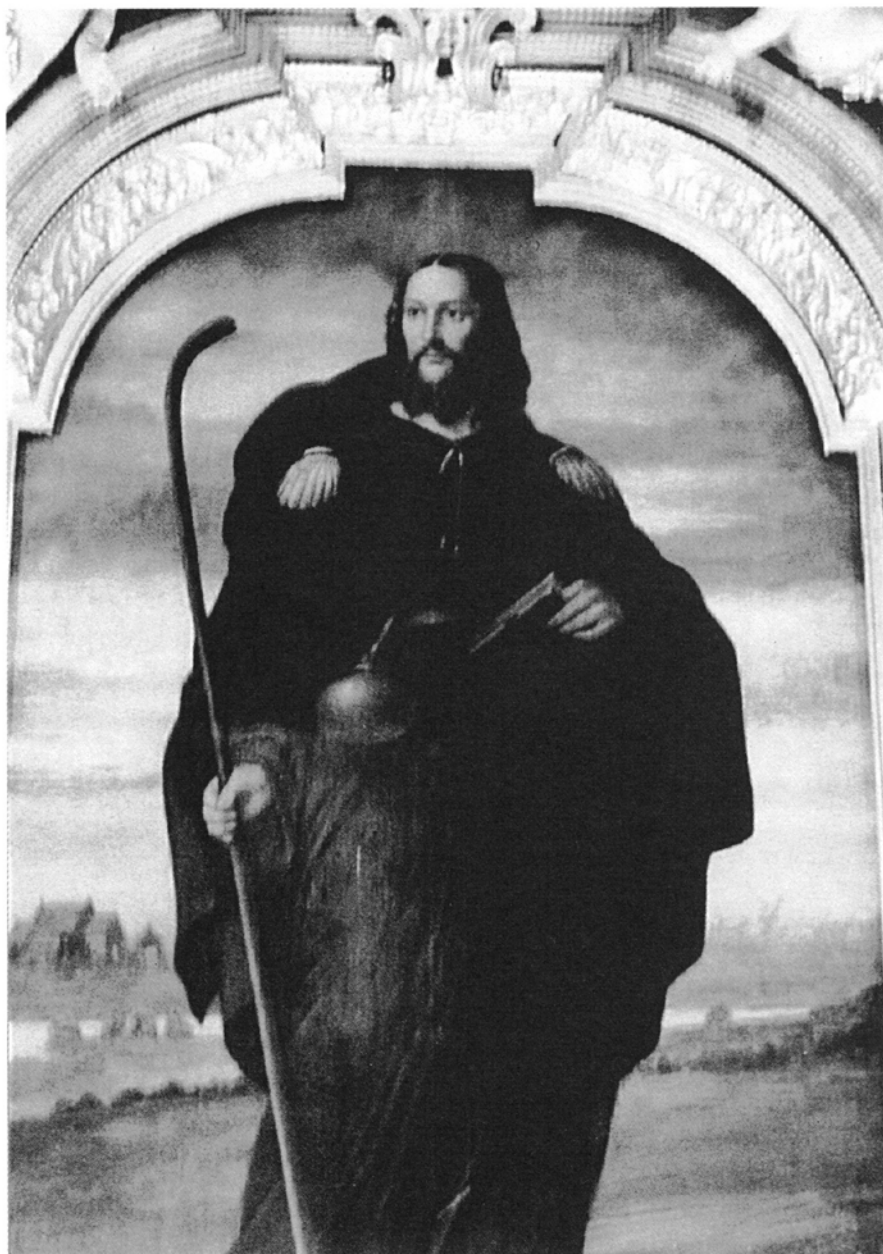
8. Poznań Starołęka, kościół św. Jakuba Większego Apostoła. Św. Jakub, obraz w ołtarzu głównym, olej na płótnie, XIX w.