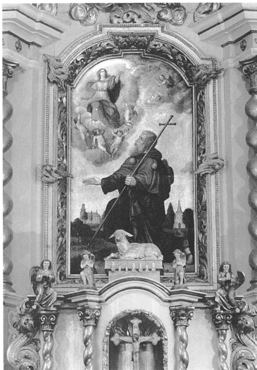
7. Dłużyna, kościół św. Jakuba Większego Apostoła, Wizja Matki Boskiej , obraz w ołtarzu głównym, olej na płótnie, XIX w.