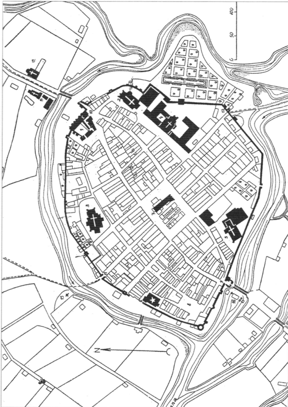
Plan miasta Kalisza z roku 1785 wg odrysu O. Wollego. 1. gród średniowieczny, 2. kościół parafialny NMP, 3. kościół Św. Mikołaja (kanoników regularnych), 4. kościół pojezuicki z przyległościami, 5. kościół i klasztor franciszkanów, 6. synagoga, 7. ratusz, 8. stary koński targ, 9. brama wrocławska, 10. brama toruńska, 11. brama piskorzewska, 12. brama łaźiebna, 13. kościół bernardynek, 14. kościół i szpital duchaków, 15. kaplica Św. Jakuba, 16. młyny miejskie. Opracowano na podstawie H. M ü n c h, Geneza rozplanowania miasta w Wielkopolsce w XIII i XIV wieku , Kraków 1946.