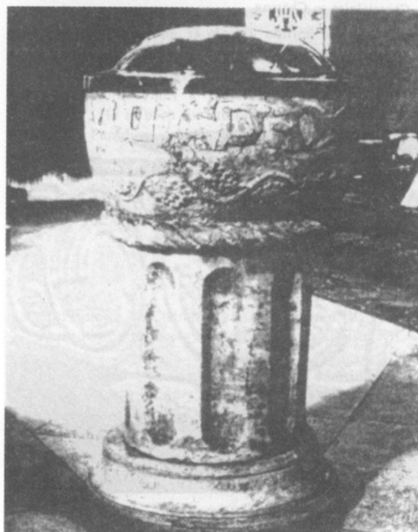
Il. 4. Chrzielnica w Chrzaszczycach, kościół Matki Boskiej Szkaplerznej, ok. poł. XII w.