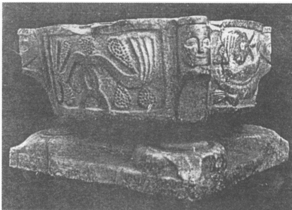
Il. 3. Chrzielnica w Lubbeck, kościół Saint Martin, XII w.