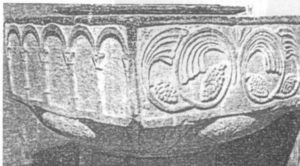
Il. 2. Chrzcielnica w Ossogne, kościół Saint Hilaire, XII w.