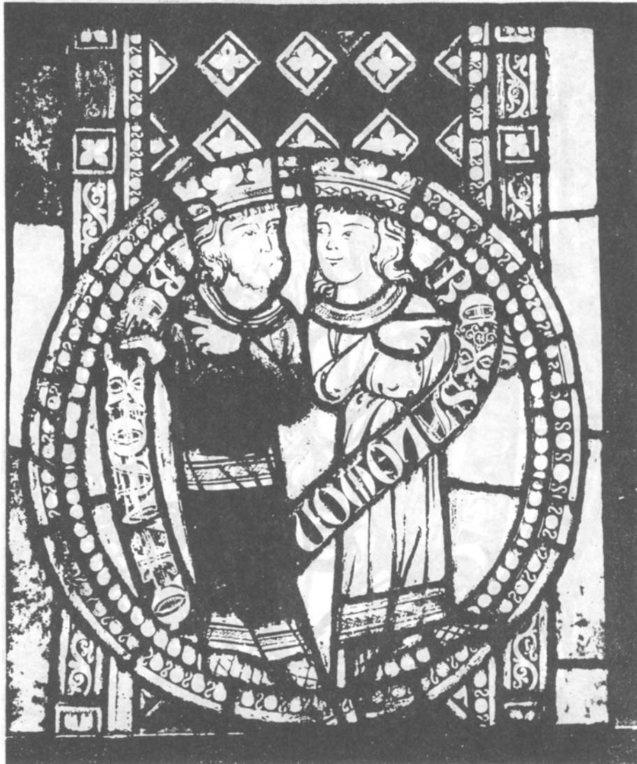
4. Włocławek, katedra. Kwaterna witraża: Dawid i Salomon.