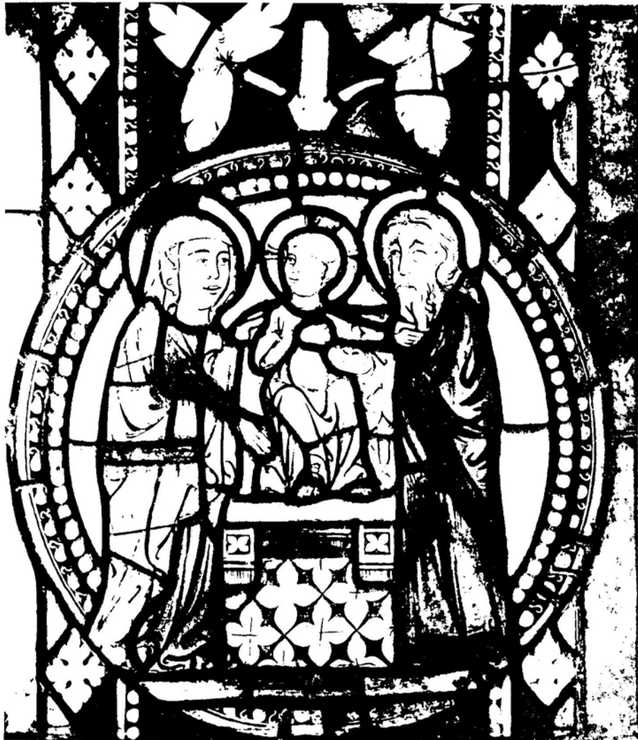
1. Włocławek, katedra. Kwaterna witraża: Ofiarowanie w świątyni