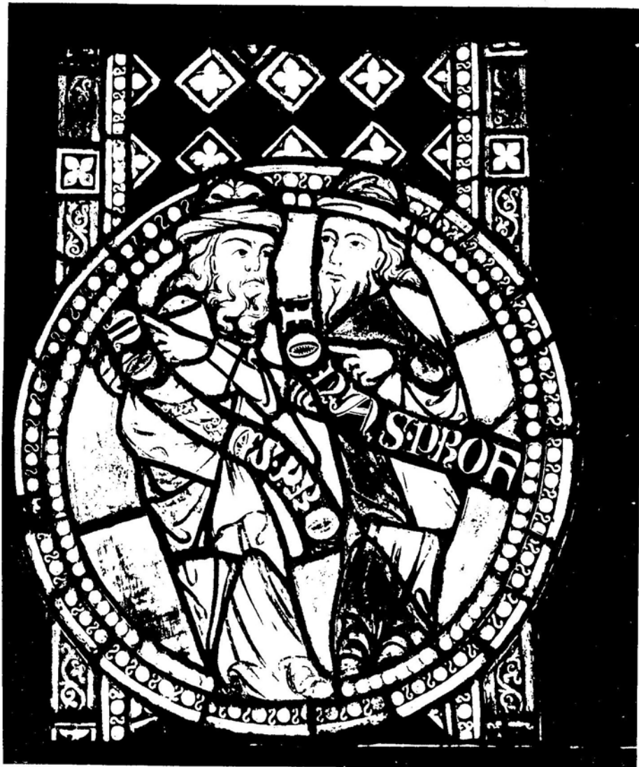
5. Włocławek, katedra. Kwaterna witraża: Mojżesz i Jonasz.