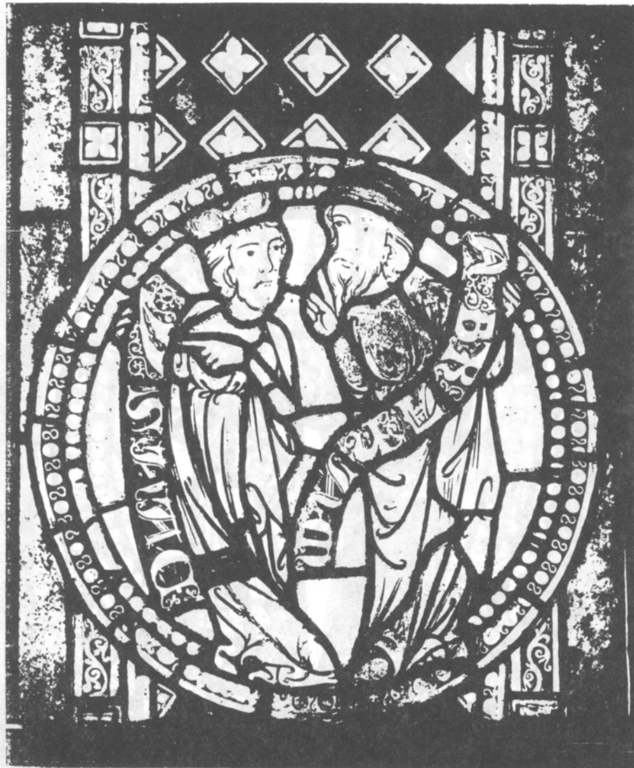
3. Włocławek, katedra. Kwatera witraża: Izaak i Abraham.