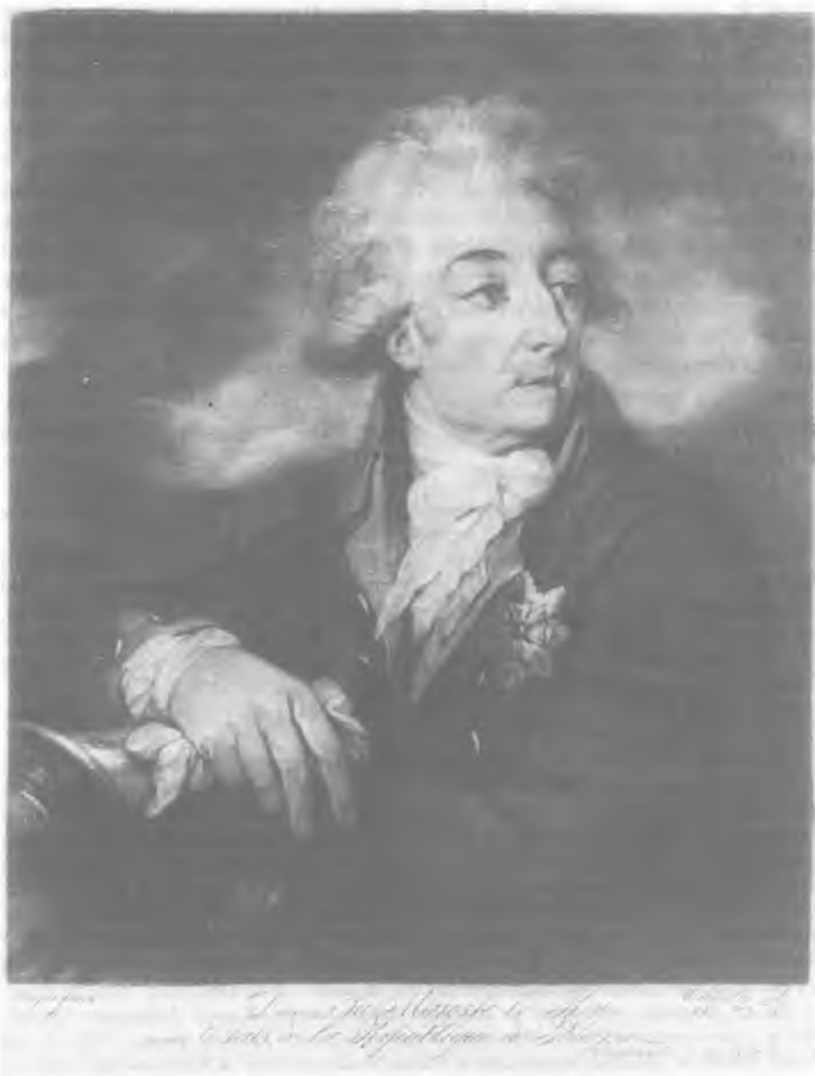
II. 2. Portret Adama Kazimierza Czartoryskiego. Wg Josefa Grassiego, mezzotinta, 1792