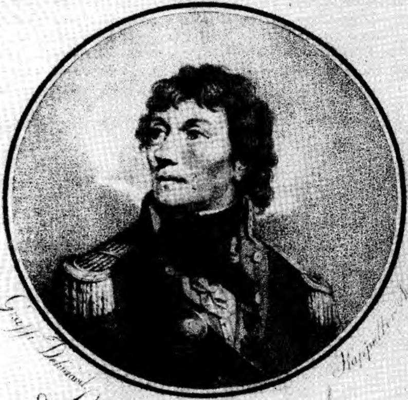
Il. 5. Portret Tadeusza Kościuszki. Wg Josefa Grassiego, miedzioryt punktowany, 1794