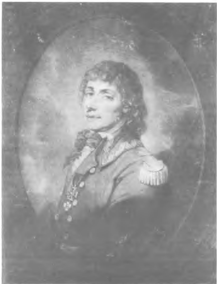
Il. 4. Portret Tadeusza Kościuszki. Wg Josefa Grassiego, mezzotinta, 1794