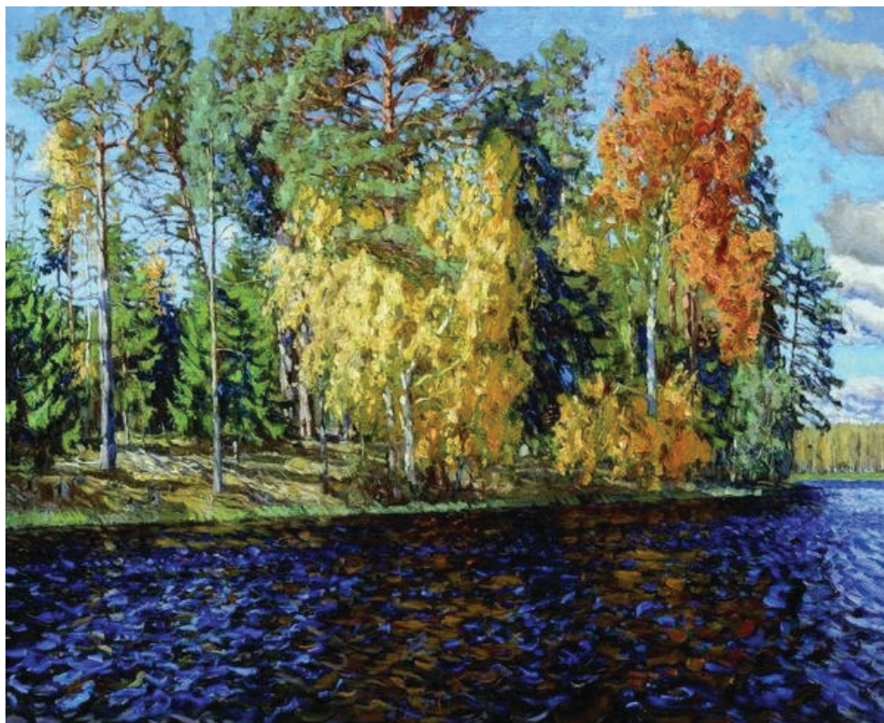
6. Stanisław Żukowski, Jeziorko w lesie. Złota jesień , 1912, olej, płótno, 116,5x142,5 cm, syng. p. d.: S. Żukowskij (cyrylica), Charkowskie Muzeum Sztuki, nr. inw. Ż-RU 330, Charkow, Ukraina