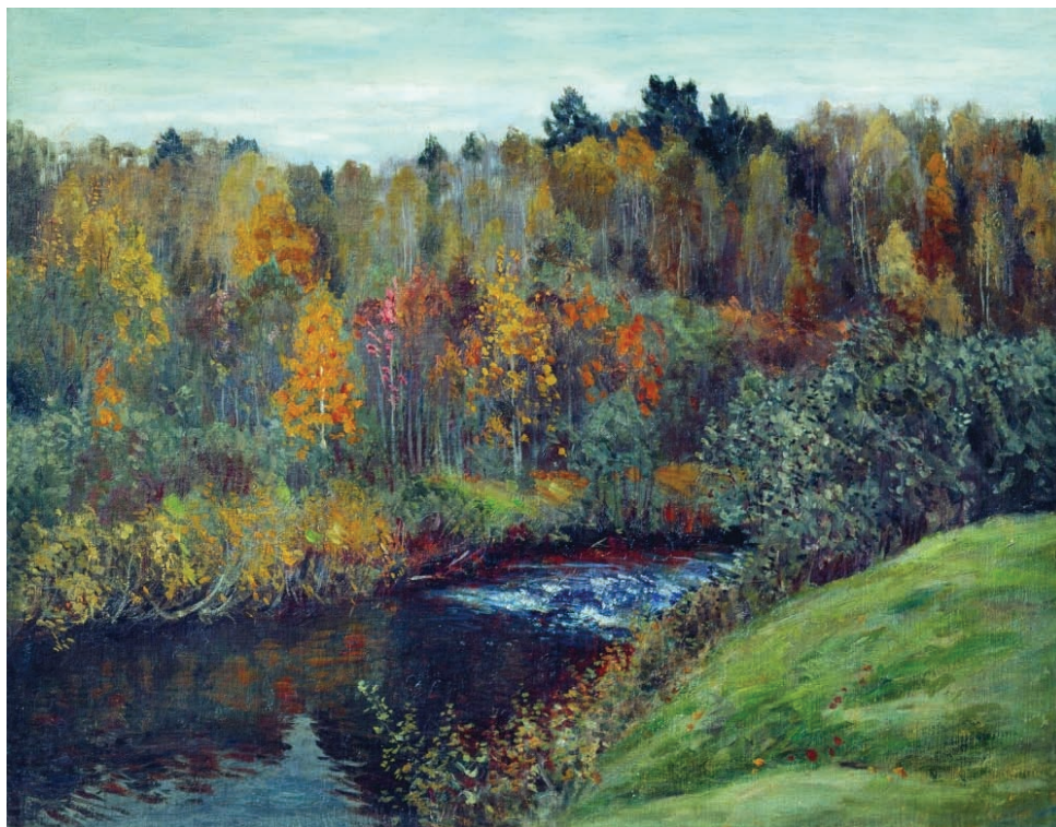
5. Stanisław Żukowski, Jesienny poranek , po 1920, olej, płótno, 71x61 cm, syng. p. d.: S. Żukowski, Dniepropetrowskie Muzeum Sztuki, nr inw. Ż107, Dniepr, Ukraina