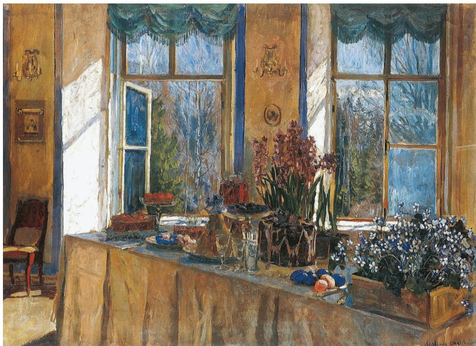
3. Stanisław Żukowski, Święto wiosny , 1912, olej, płótno, 97,5x132 cm, syng. p. d.: Akademiak S. Żukowskij (cyrylica), Muzeum Narodowe „Kijowska Galeria Obrazów”, nr inw. Ż-127, Kijów, Ukraina