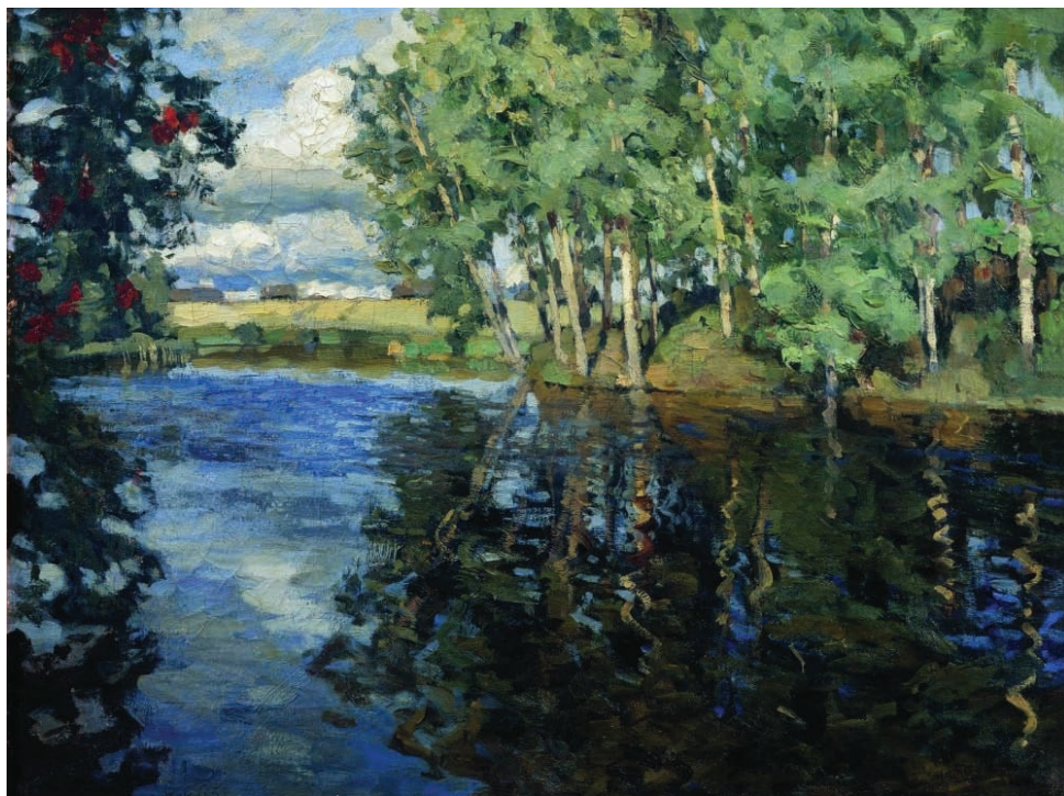
2. Stanisław Żukowski, Rzeka , 1904, olej, płótno, 62x80 cm, syng. l. d.: S. Żukowskij 1904 (cyrylica), Odesskie Muzeum Sztuki, nr inw. 500-Ż, Odessa, Ukraina