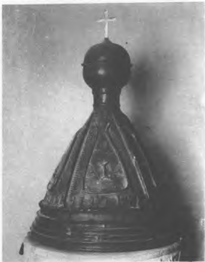
7. Muzeum w Łęczycy. Przykrywa chrzcielnicy Negatyw w Instytucie Sztuki PAN