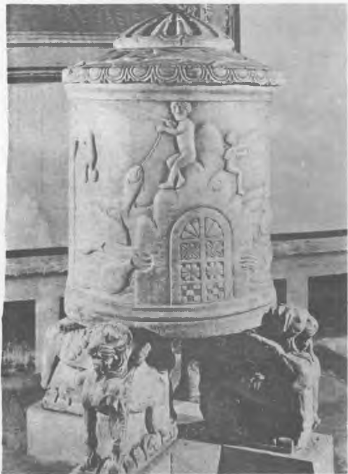
1. Grottaferrata, kościół. Chrzcielnica