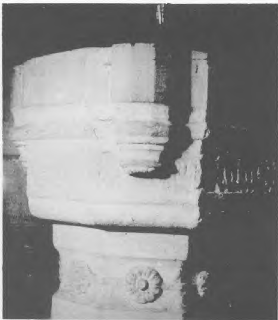
11. Lubsza, kościół. Chrztelnica