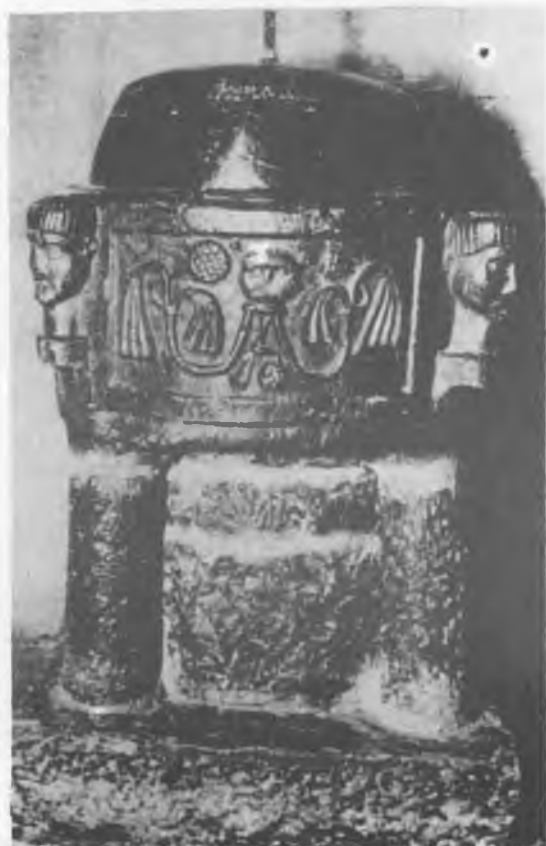
4. Bastogne, kościół. Chrztelnica