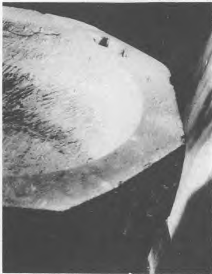
8. Brzostów, kościół. Chrzcielnica