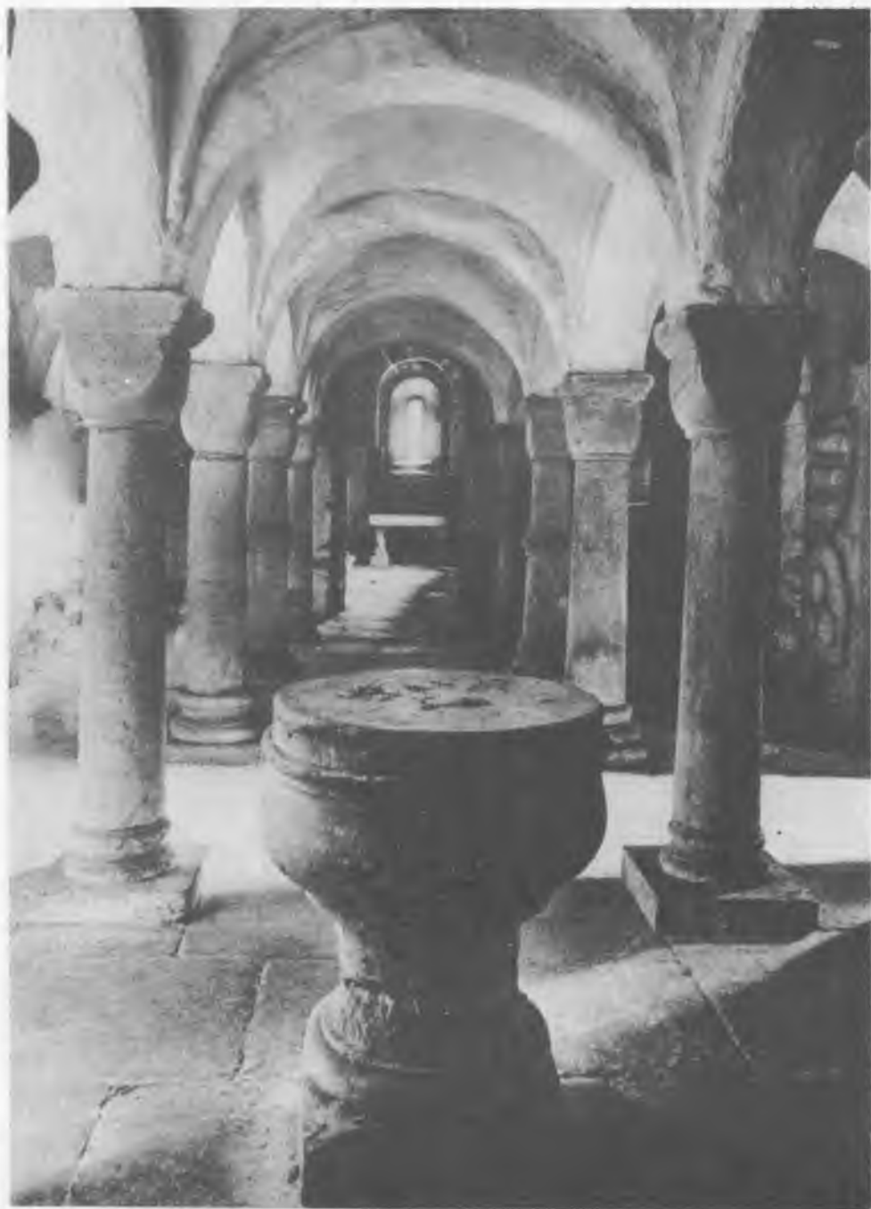
5. Oberstenfeld, kościół. Chrzcielnica.