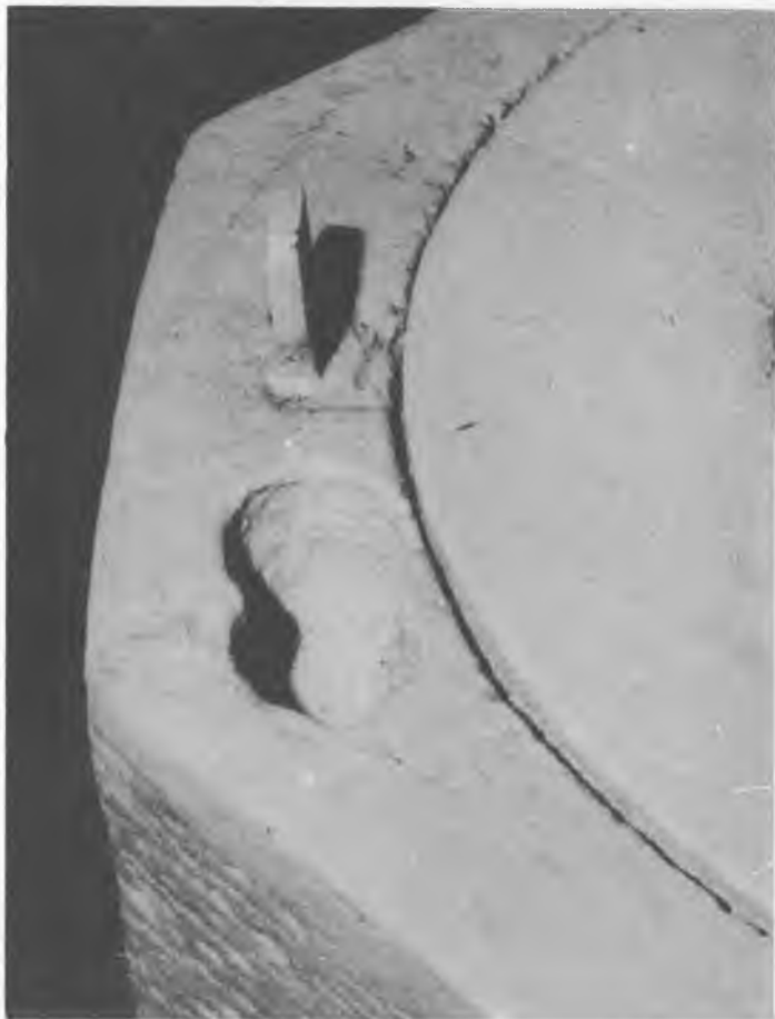
9. Kłoda, kościół. Fragment chrzcielnicy