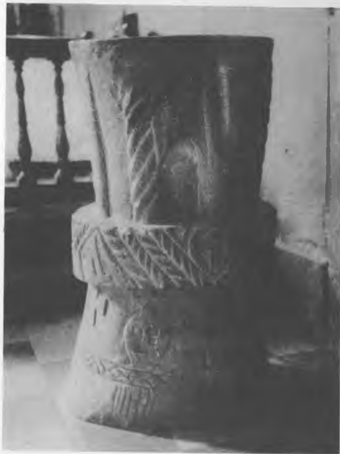
10. Żmigród Stary, kościół. Chrzcielnica