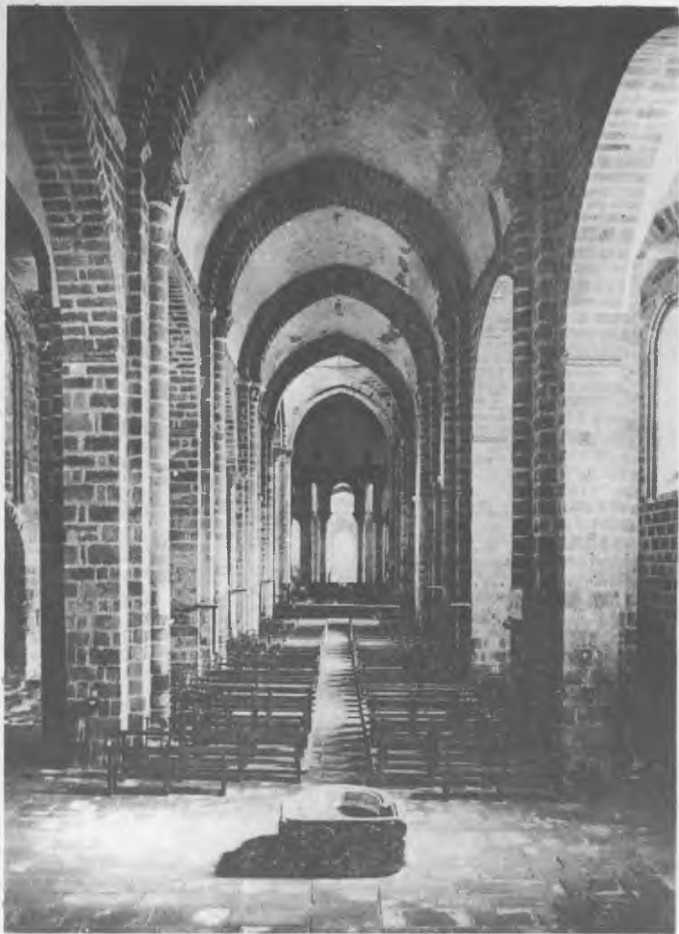
6. Le Dorat, kościół. Chrzcielnica