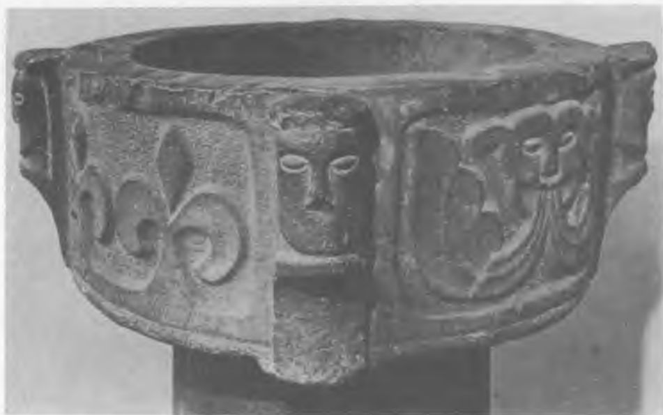
3. Musées Royaux d'Art et d'Histoire w Brukseli. Chrztelnica z Veerle