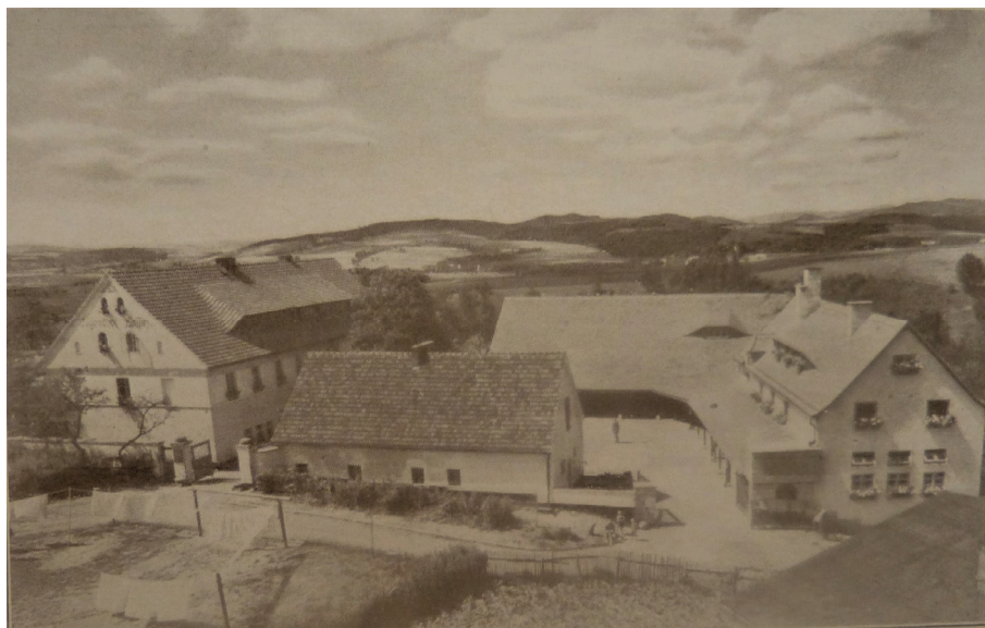
Fotografia 1. Jugendhof Hassitz ( Musik und Kirche , z. 1, 1930)

Jugendhof Hassitz działał jako ośrodek odnowy ruchu śpiewaczego zaledwie siedem lat. W tym czasie przewinęło się przez niego kilkadziesiąt tysięcy osób. W 1930 r. liczba uczestników różnego rodzaju kursów wyniosła ponad 18 tysięcy, a w 1932 roku około 30 tysięcy. W 1933 roku ośrodek został przejęty przez organizację Hitlerjugend , która zmieniła profil jego działalności. W latach 1943-1945 mieściła się tu m.in. szkoła muzyczna ( NS-Gebietsmusikschule ).