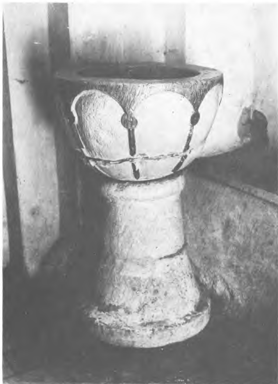
12. Małkocin. Kościół filialny. Chrzcielnica. Instytut Sztuki PAN