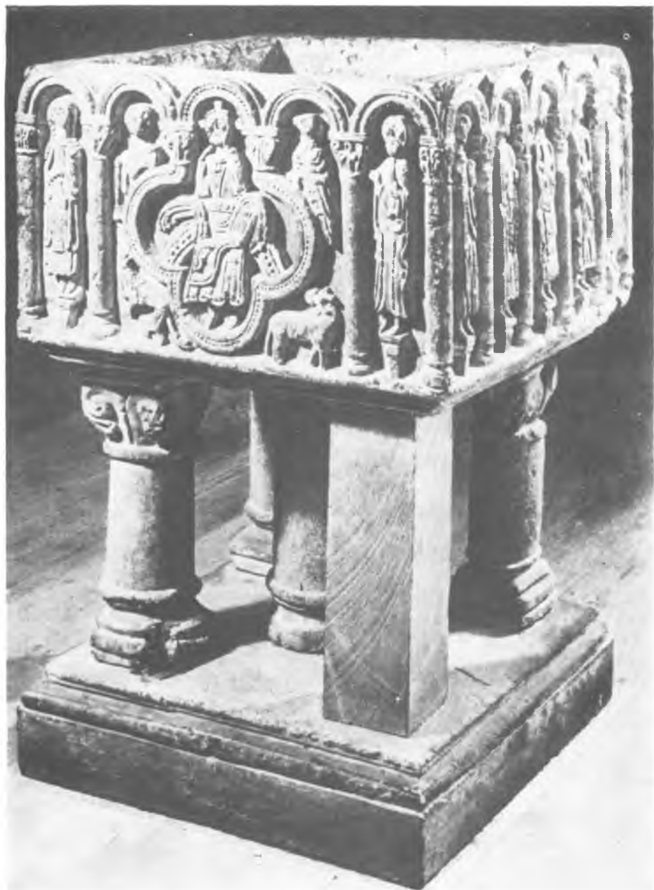
4. Skjeberg (Ostfold). Chrzcielnica. W: Armin Tuulse. Skandynawia Romańska . Warszawa 1970 il. 187