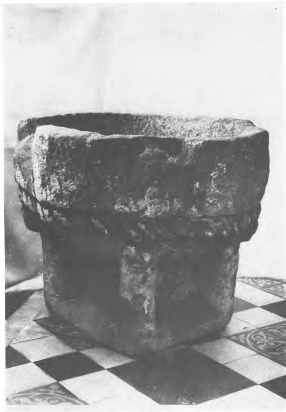
8. Wrocław. Muzeum Archidiecezjalne. Chrzcielnica. Instytut Sztuki PAN.