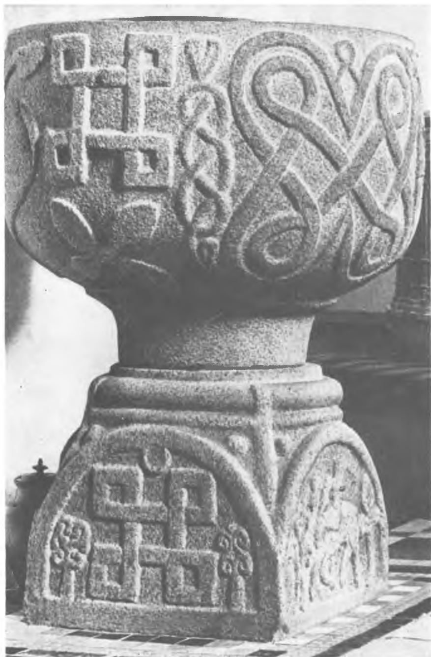
10. Öster Starup. Chrzielnica. W: Armin Tuulse. Skandynawia Romańska , Warszawa 1970 il. 72