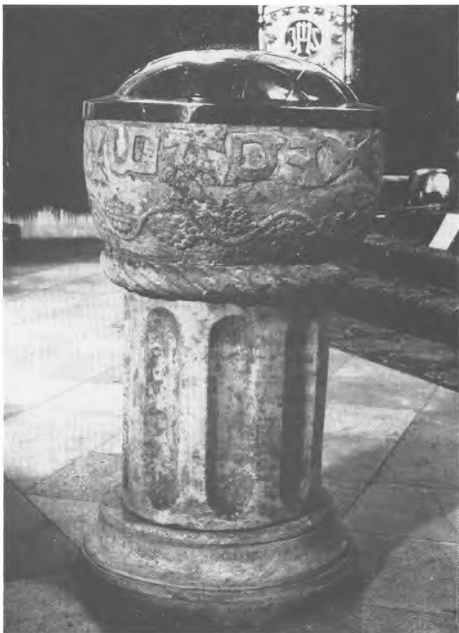
7. Chrzęszczyce. Kościół Matki Boskiej Szkaplerznej. Chrzcielnica. Instytut Sztuki PAN