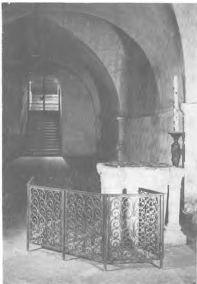
2. Chartres, Katedra Notre-Dame. Chrztelnica