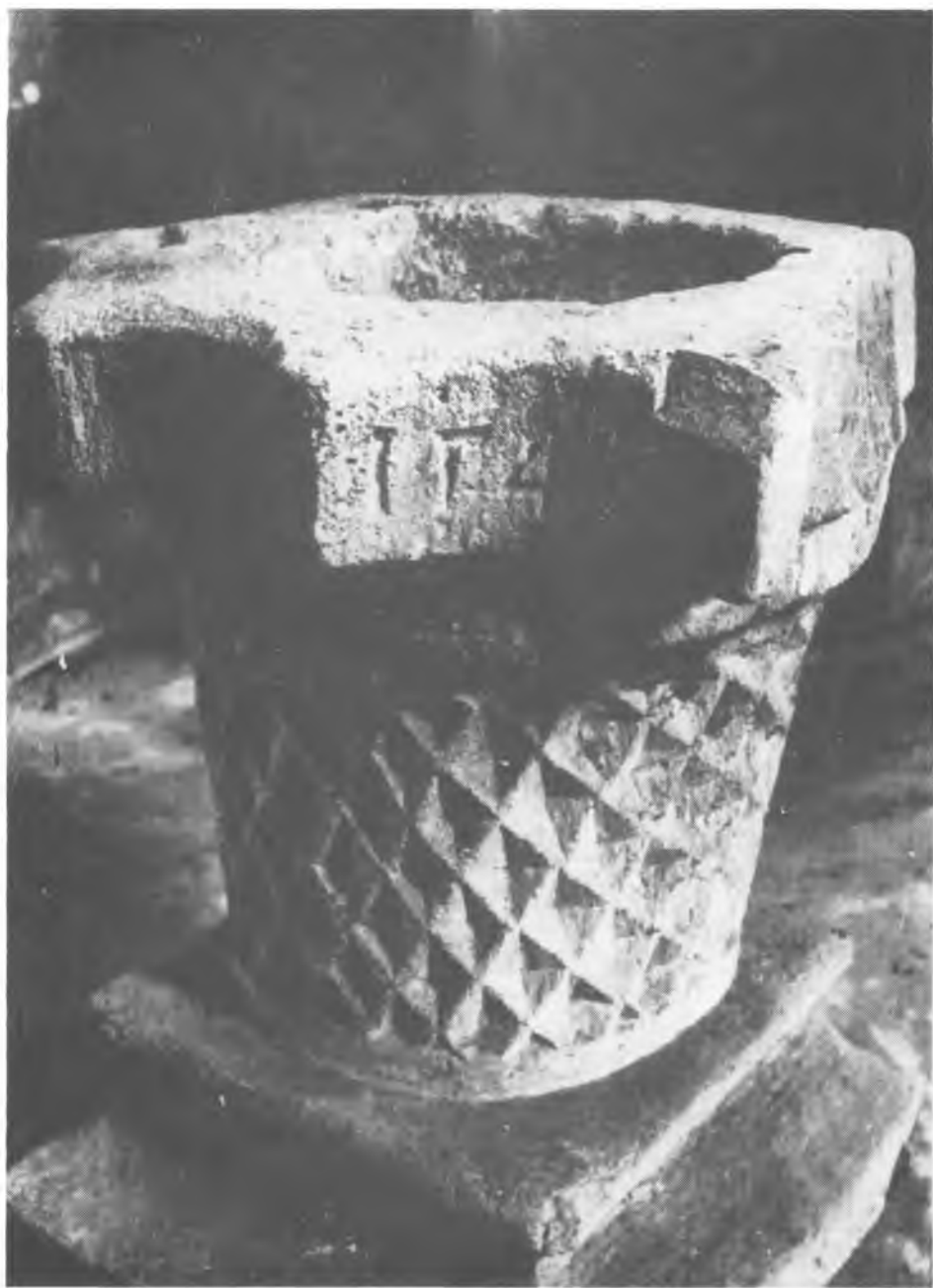
9. Wysokie. Kościół św. Michała Archanioła. Kropielnica. Instytut Sztuki PAN.