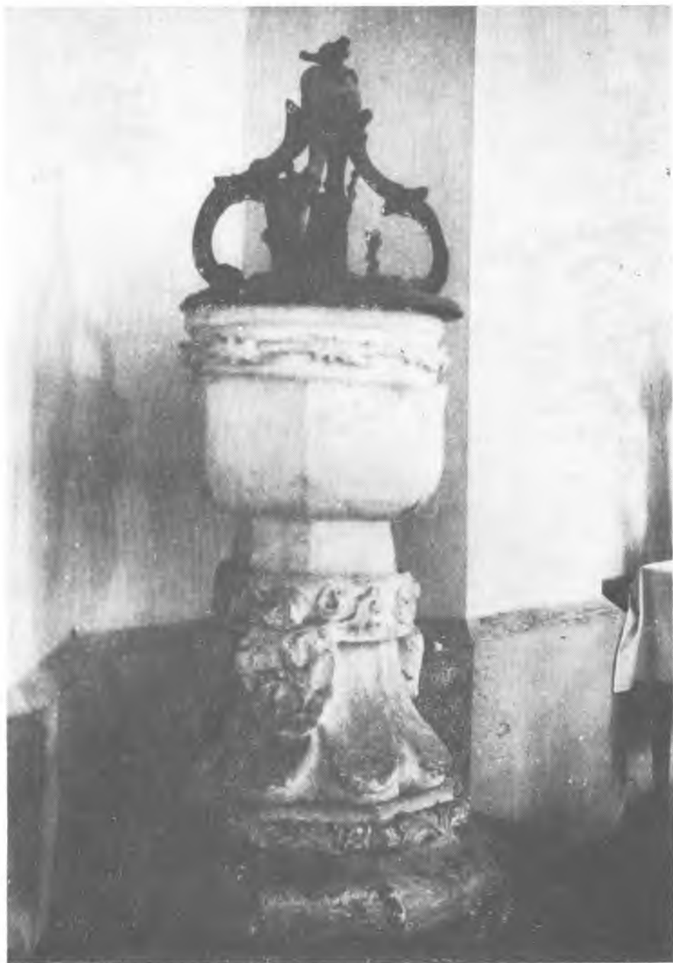
11. Poręba Radlna. Kościół św. Piotra i Pawła. Chrzcielnica. Instytut Sztuki PAN fot. R. Kaźmierski