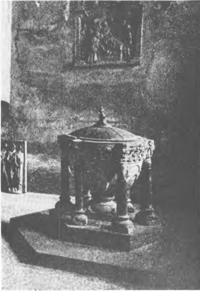
5. Andernach. Chrzcielnica. W: W. Schäfer, Aus der alten Reichsherrlichkeit . München 1934 il. s. 69