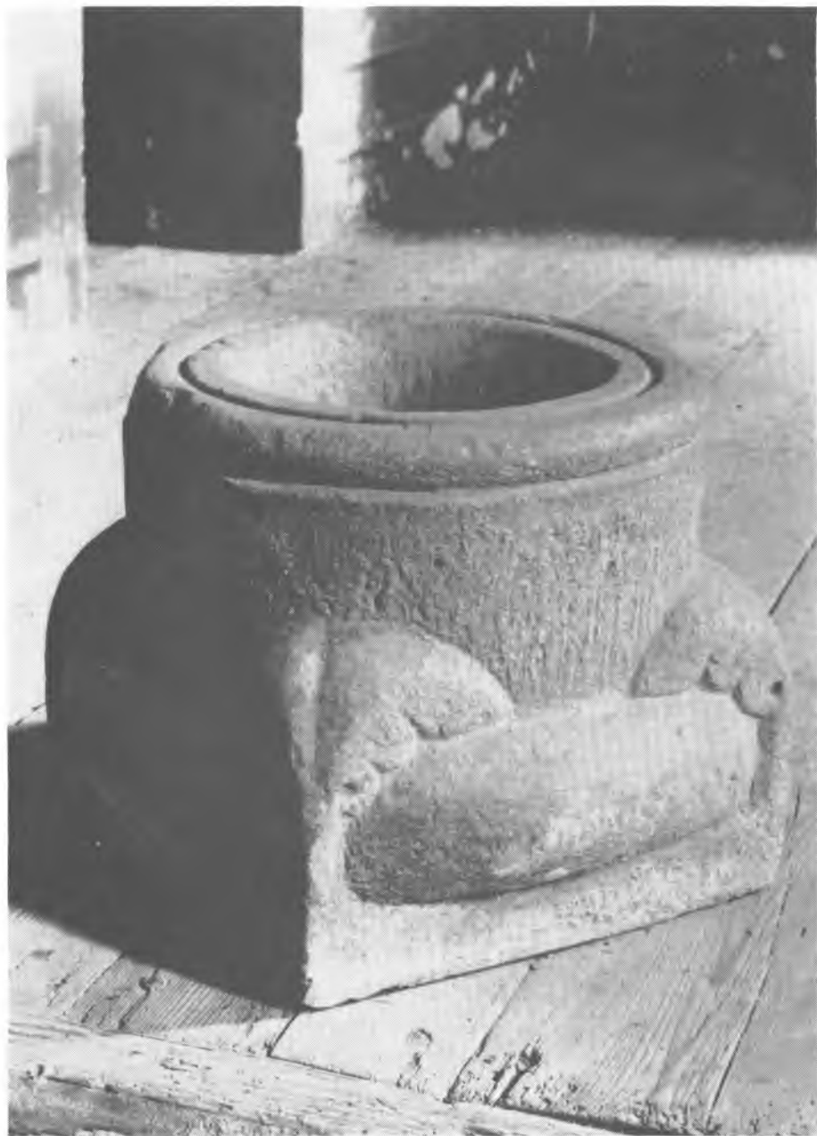
6. Konin — Stare Miasto. Kościół św. Piotra i Pawła. Chrzcielnica, Instytut Sztuki PAN