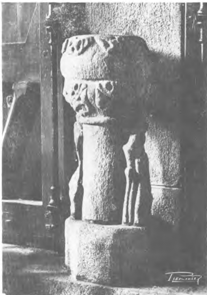
1. Geurande, Kolegiata St. Aubin, chrzcielnica (kropielnica?)