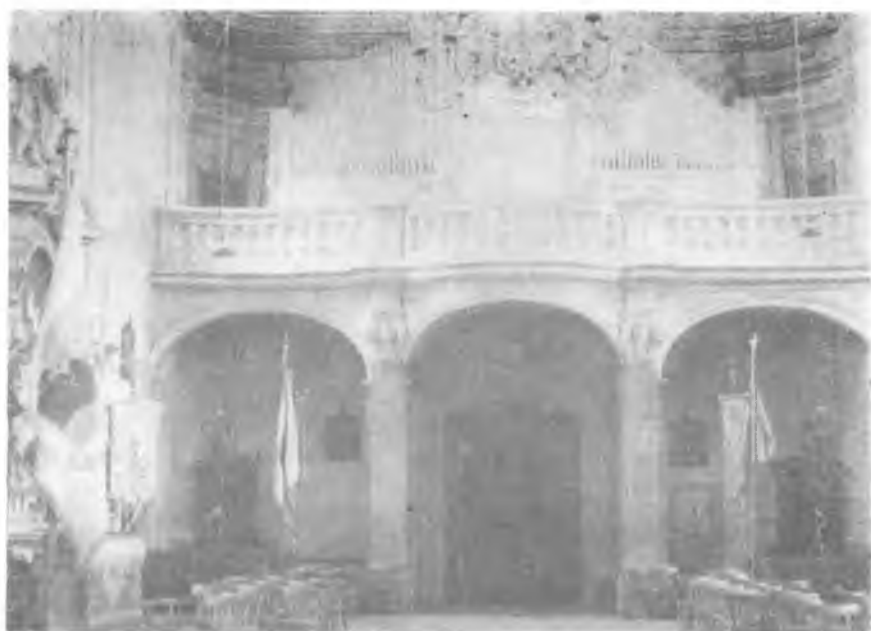
Ryc. 5. Kościół w Kobylance. Wnętrze nawy.