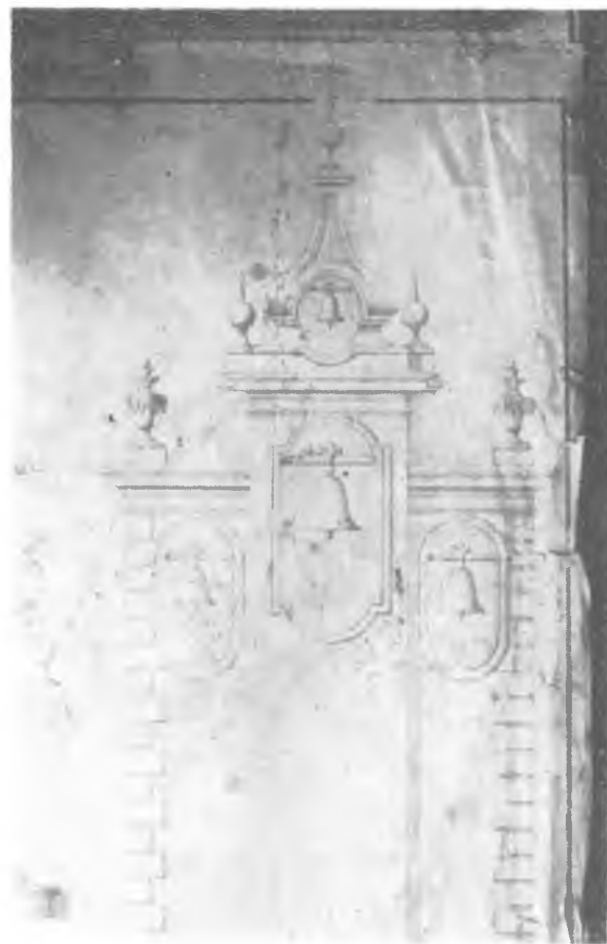
Ryc. 10. Rysunek Placidiego.