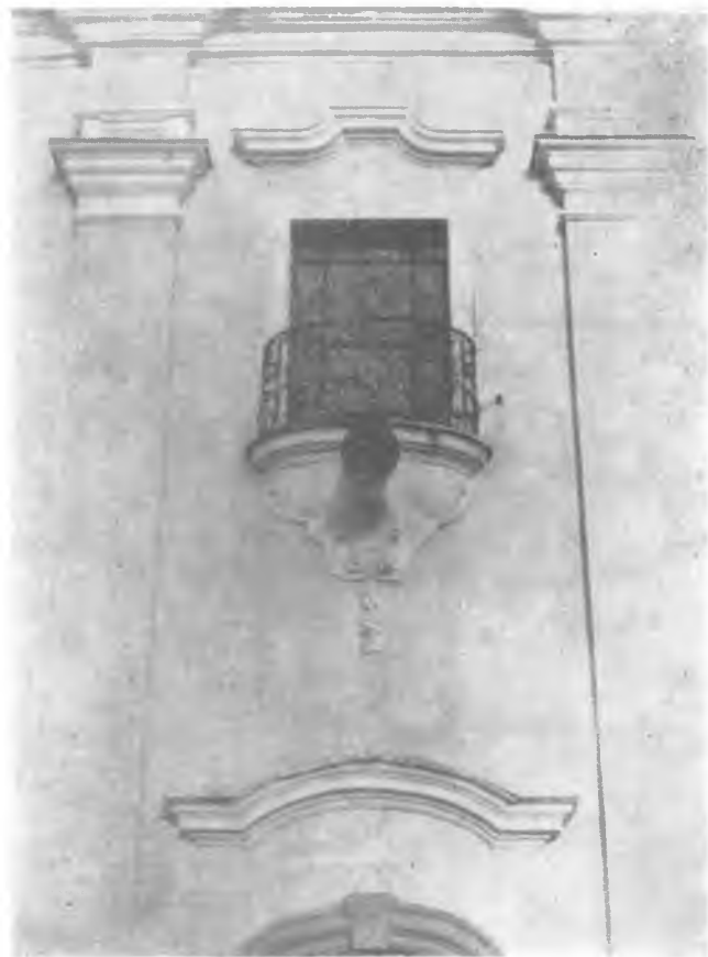
Ryc. 4. Fasada. Okna nad portalem.