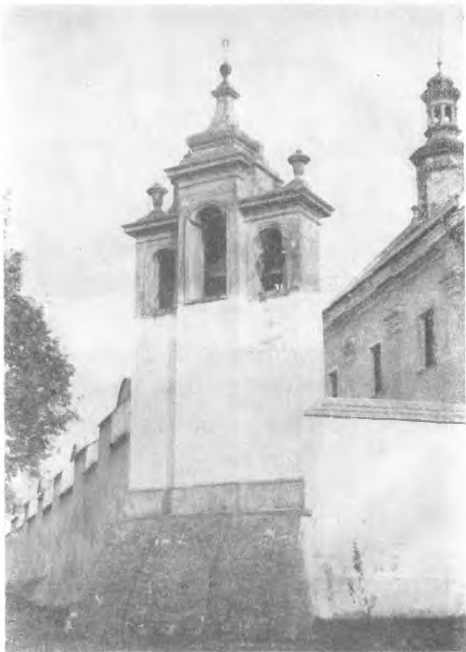
Ryc. 7. Kobylanka. Dzwonnica przy kościele.