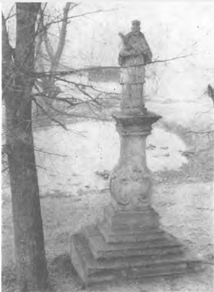
Ryc. 9. Kobylanka. Figura przy drodze przed bramą kościelną.