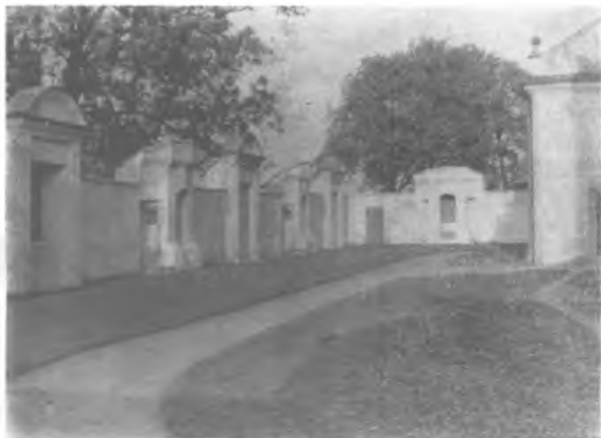
Ryc. 6. Kobylanka. Cmentarz kościelny.