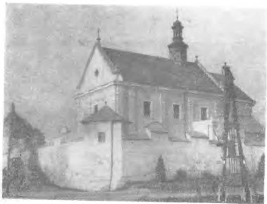
Ryc. 2. Kościół w Kobylance. Widok zewnętrzny całości.