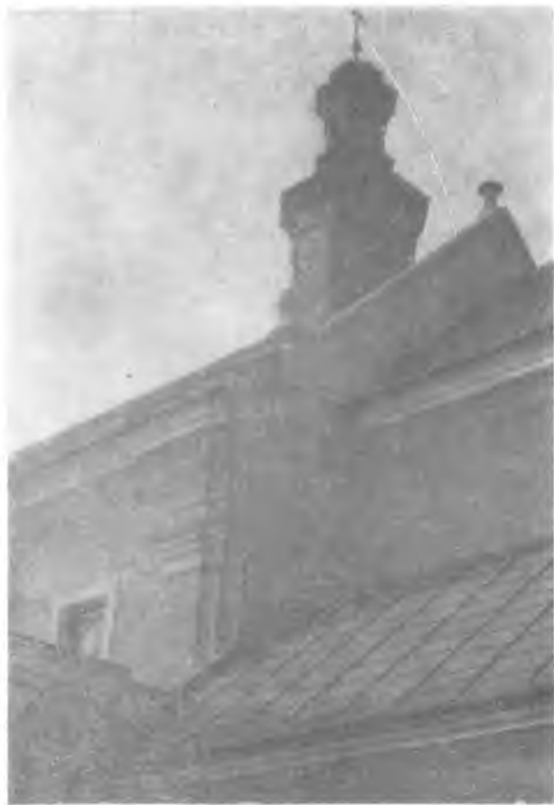
Ryc. 3. Widok zewnętrzny. Fragment.