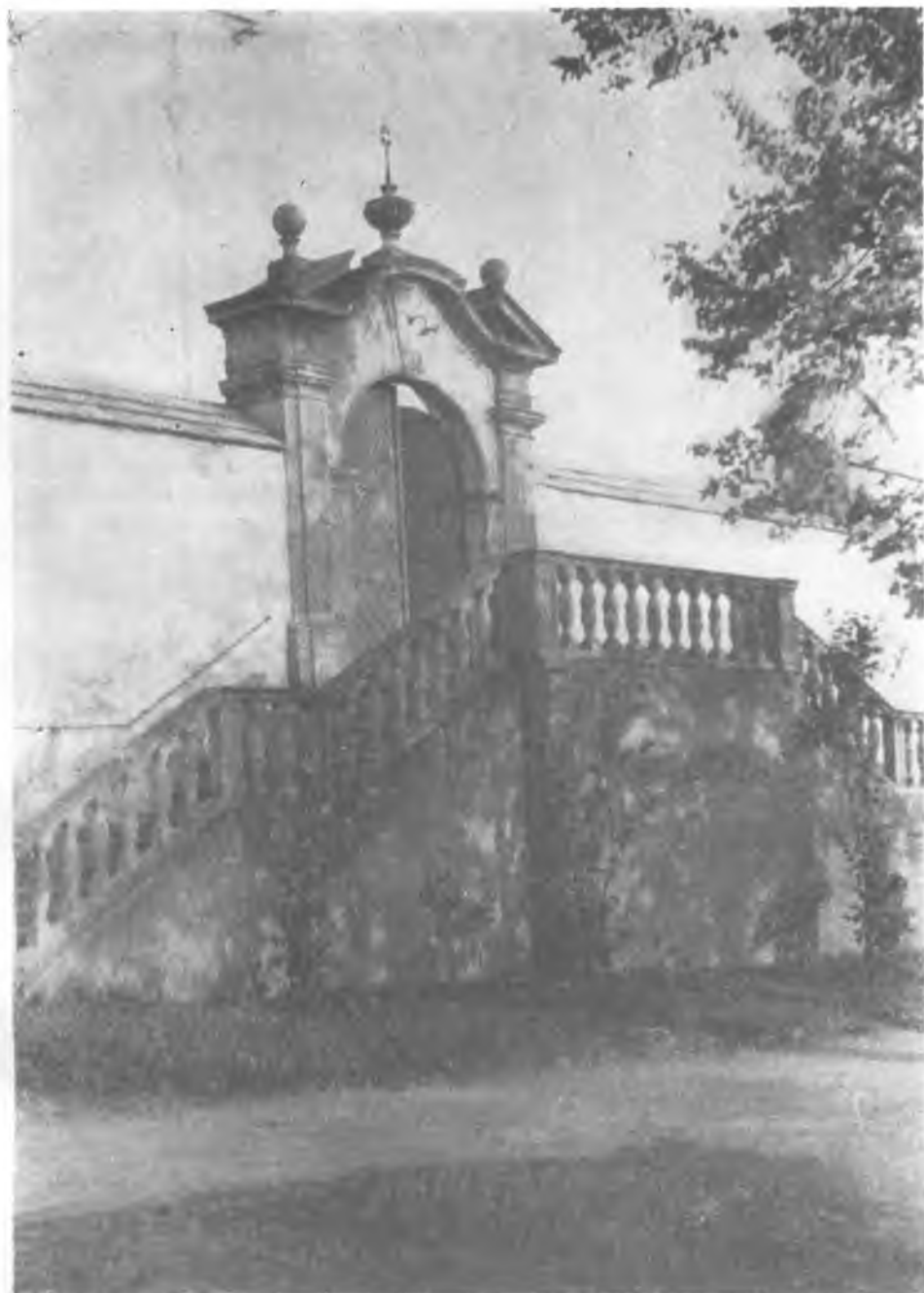
Ryc. 8. Kobylanka. Brama w murze przed kościołem.