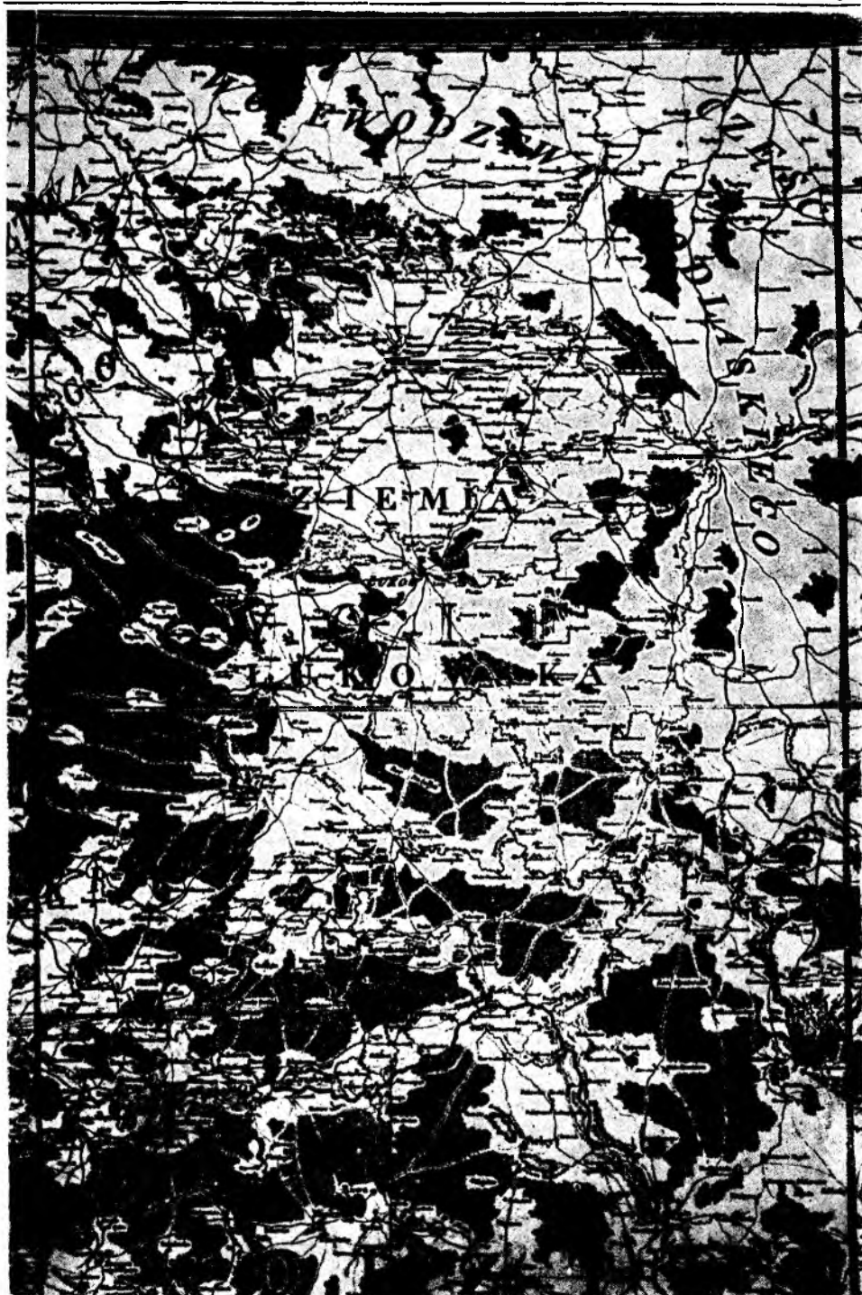
Ziemia łukowska z: Mappa szczególna województwa lubelskiego zrzadzona z wielu mapp miejscowych — — przez Karola de Perthéesa, Paris 1786.