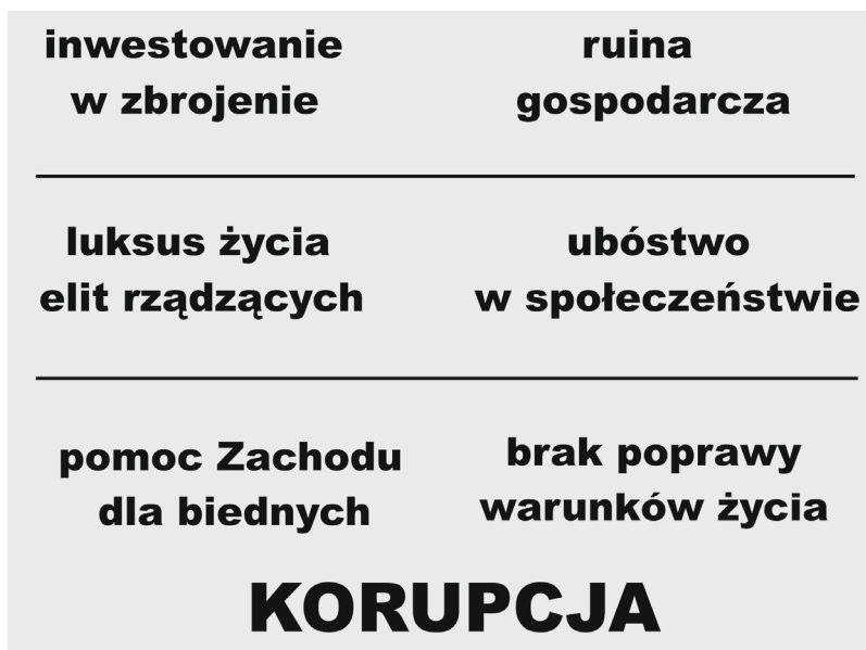
Rysunek 2. Sprzeczności towarzyszące korupcji w państwach upadłych