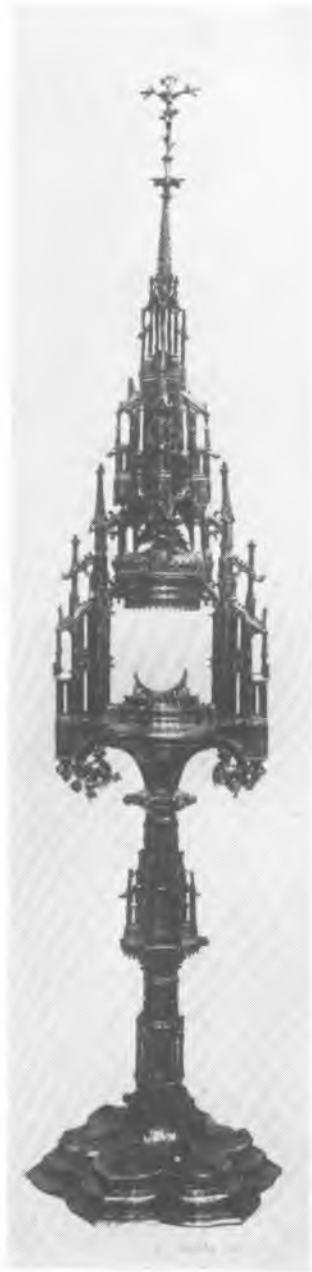
4. Monstrancja z kościoła św. Jana Chrzciciela w Chojnicach (ostatnia ćwierć XV w.)