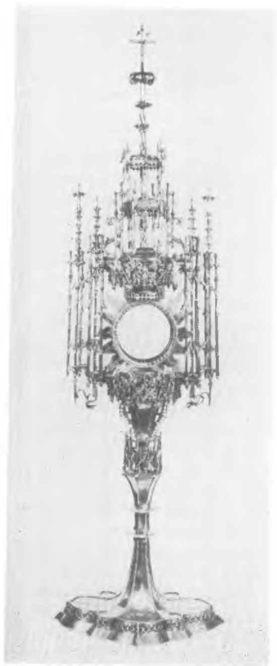
6. Monstrancja z kościoła św. Trójcy w Gnieźnie (koniec XV w.)