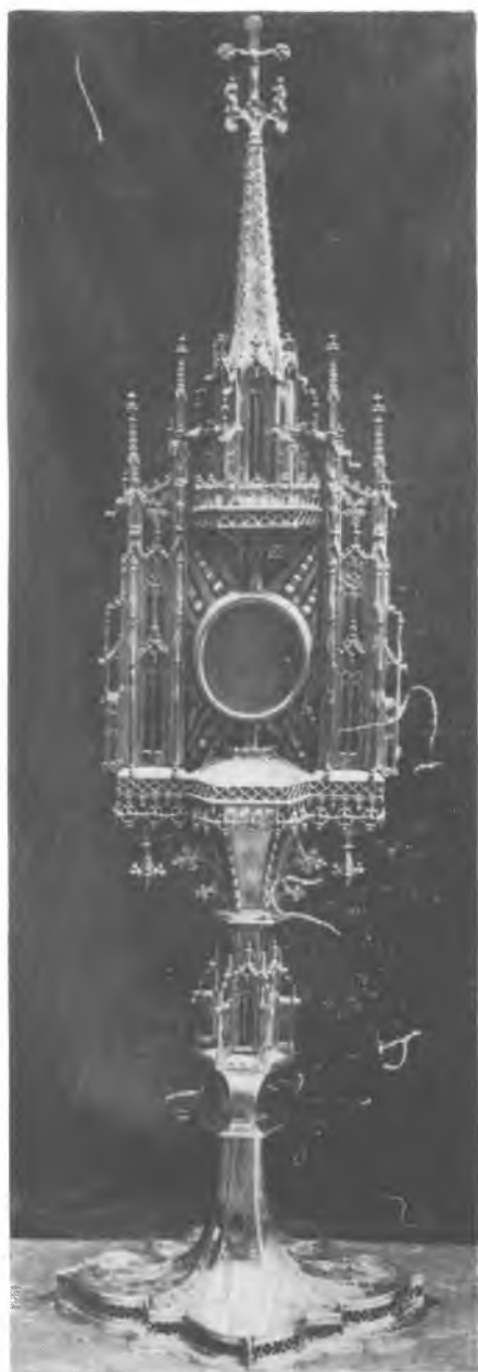
1. Monstrancja z kościoła parafialnego w Luborzycy (ok. 1460—70)