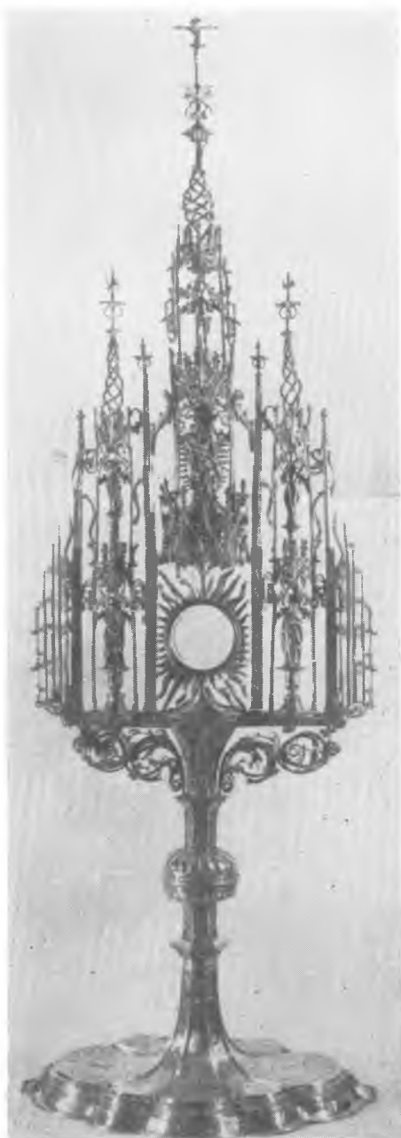
2. Monstrancja z Jasnej Góry w Częstochowie (1542 r.)